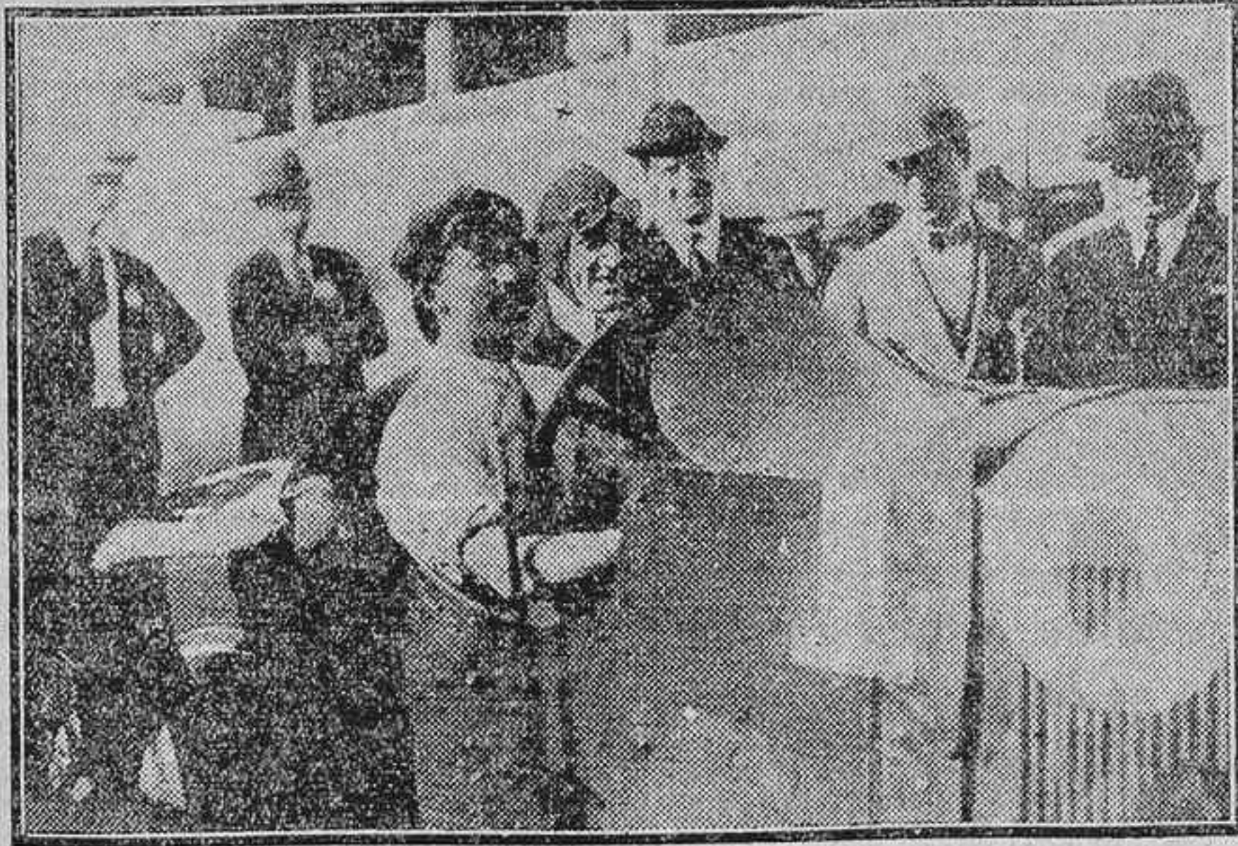
EL BOXEADOR FRANCÉS G. JORGE CARPENTIER, DESPUES DE SUS LUCHAS CON EL AMERICANO DEMPSEY Y EL SENEGALÉS BATLING SIKI, HA DECIDIDO CONSAGRARSE AL DEPORTE AUTOMOVILISTA