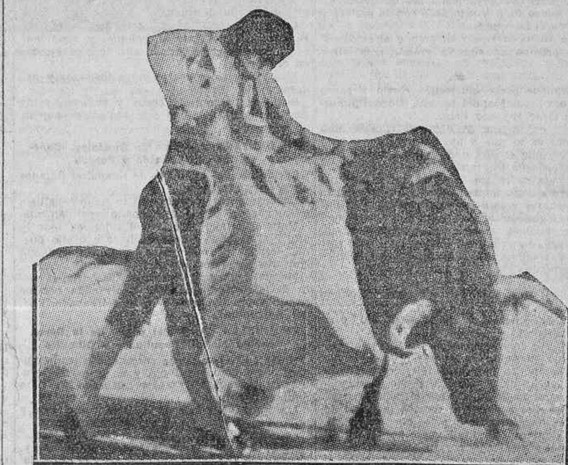
LA CORRIDA DE AYER EN MADRID.—Nacional II en un quite