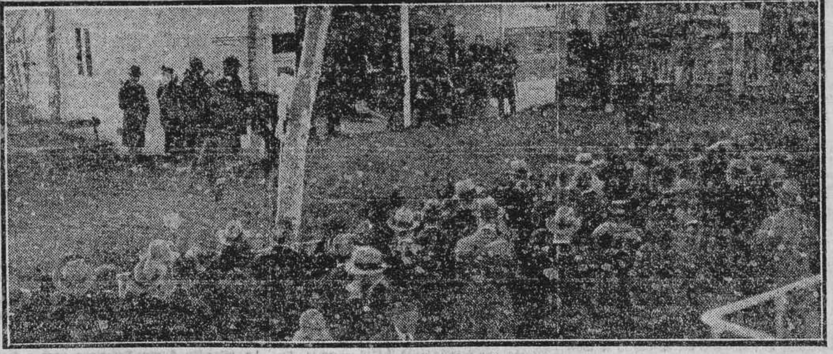
EL PUBLICO PRESENCIANDO LA SU BASTA EN EL PREMIO A RECLAMAR