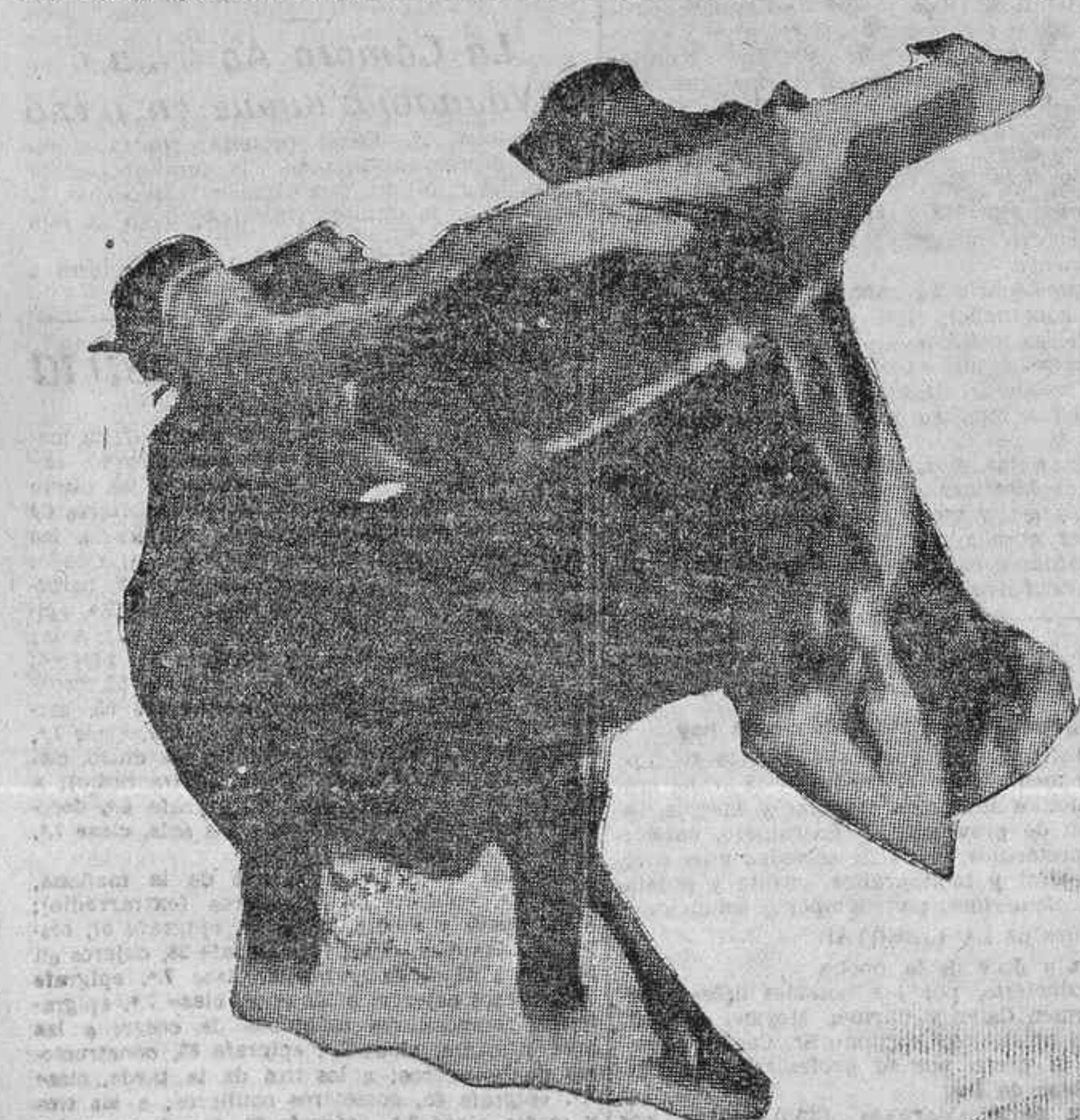
LA CORRIDA DE AYER EN MADRID.—Cogida de Valencia II