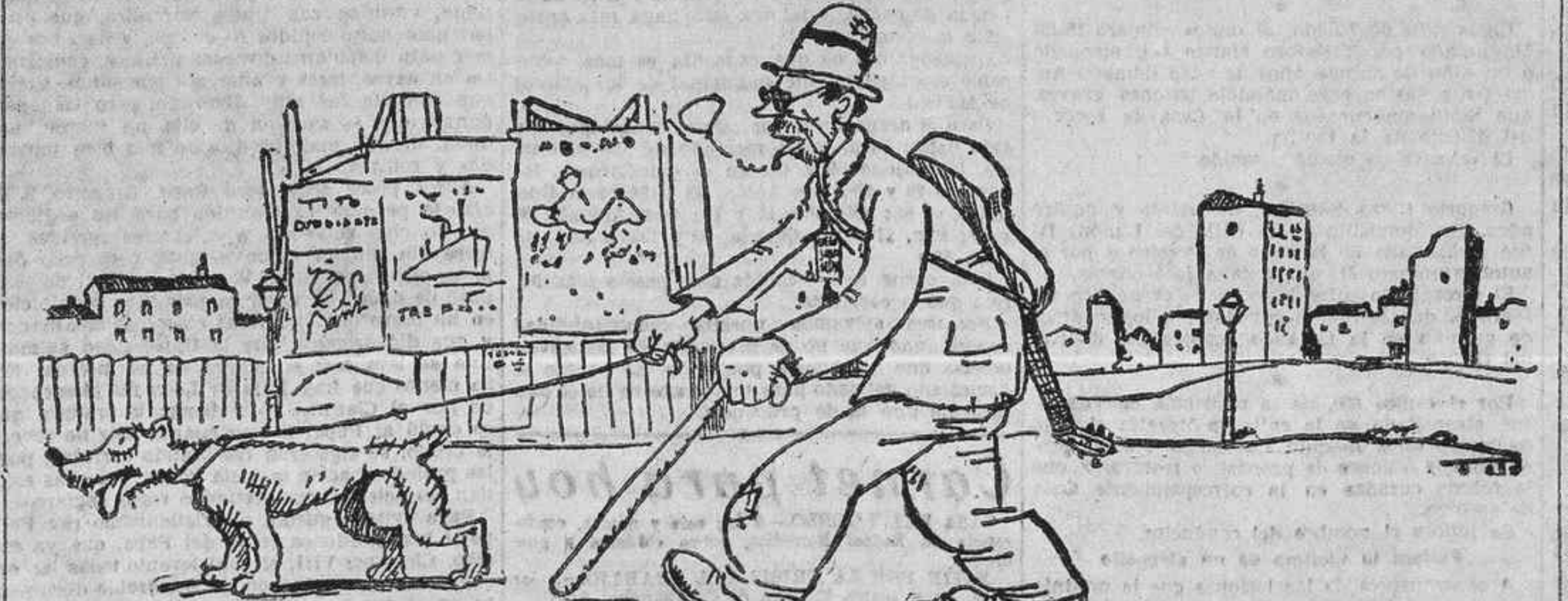
El ciego, sordomudo.—Nada, nadie me tiene lástima... ¡Como todos están lo mismo!