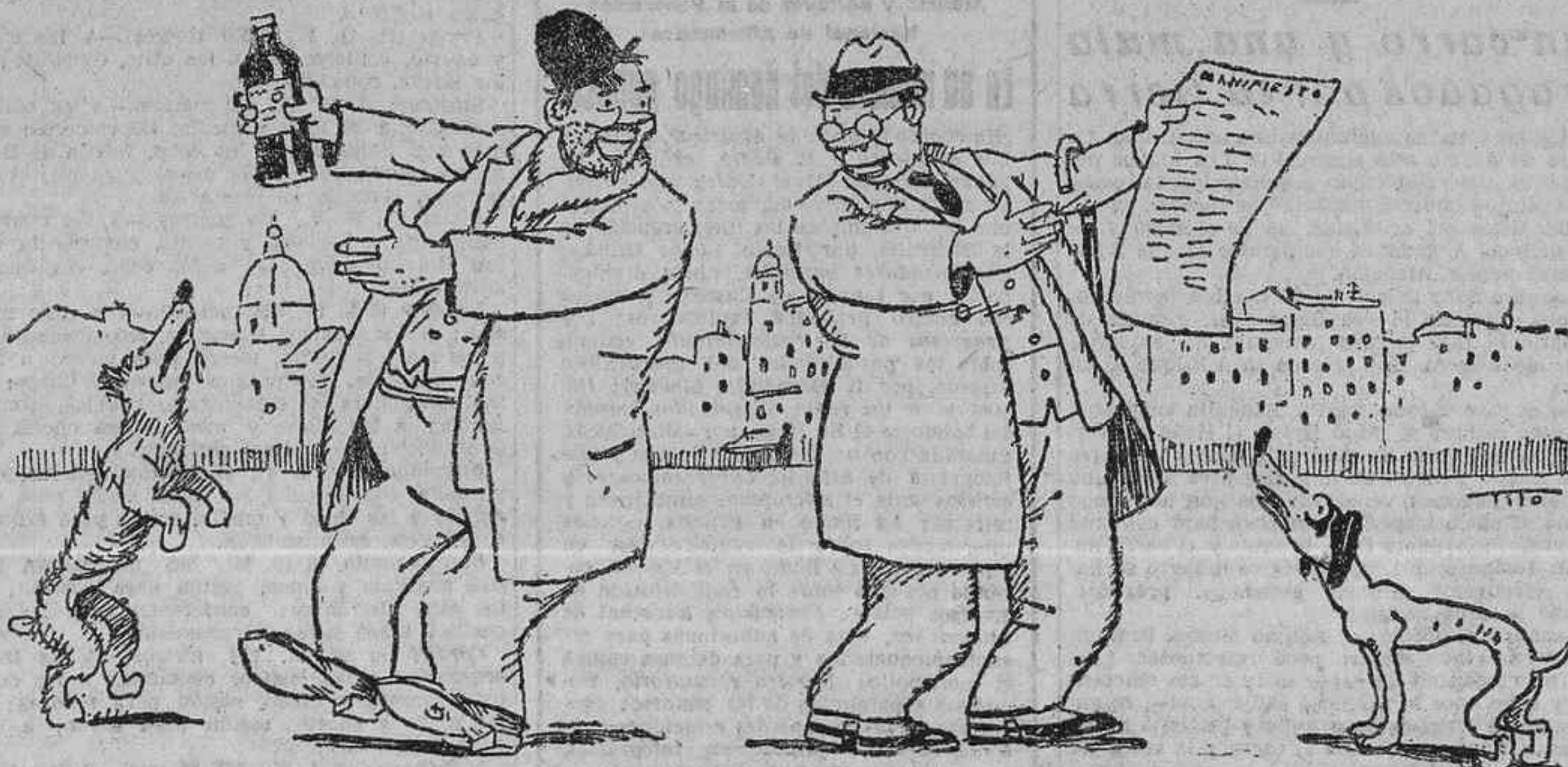
--Aquí tienes... ¡de la U. P. I. --Aquí tienes... ¡de N. P. U. I.