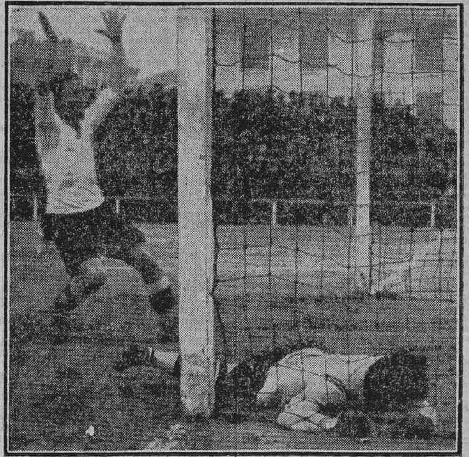
LA FERROVIARIA, SEMIFINALISTA.—UNO DE LOS «GOALS» MADRILEÑOS QUE SANTISO NO QUIERE VER

Equipos: Málaga: Santizo, Marmolejo-Schneider, Vides-Fuentes-Casado, Kutznar-Vallerías-Huelin-Coral-Inguzu.