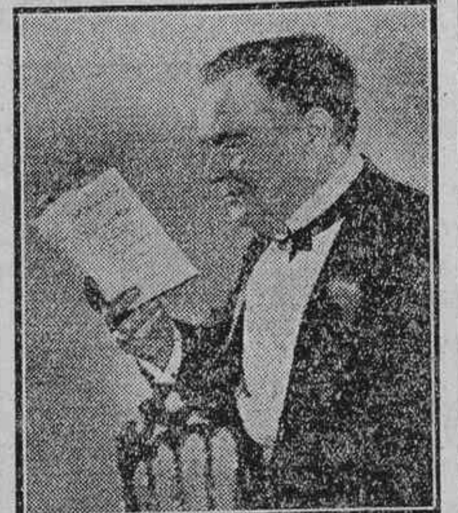
El famoso actor de carácter George Leigman que encontrasen en su camino, a la par que les decían: «Si quiere usted recibir otro beso igual, vaya al cine, en donde se da el film descrito en este programa—al mismo tiempo que entregaban un ejemplar del prospecto.»

He aquí cómo relata una revista americana la curiosa manera de lanzar un film: «Durante la presentación de la cinta «Circe, la hechicera» en el Strand Theatre de la ciudad de Moins, en los Estados Unidos, los directores del establecimiento, que habían contratado previamente a una veintena de mujeres bonitas, ordenaron a éstas que se paseasen por las calles y avenidas de la ciudad besando a cada hombre