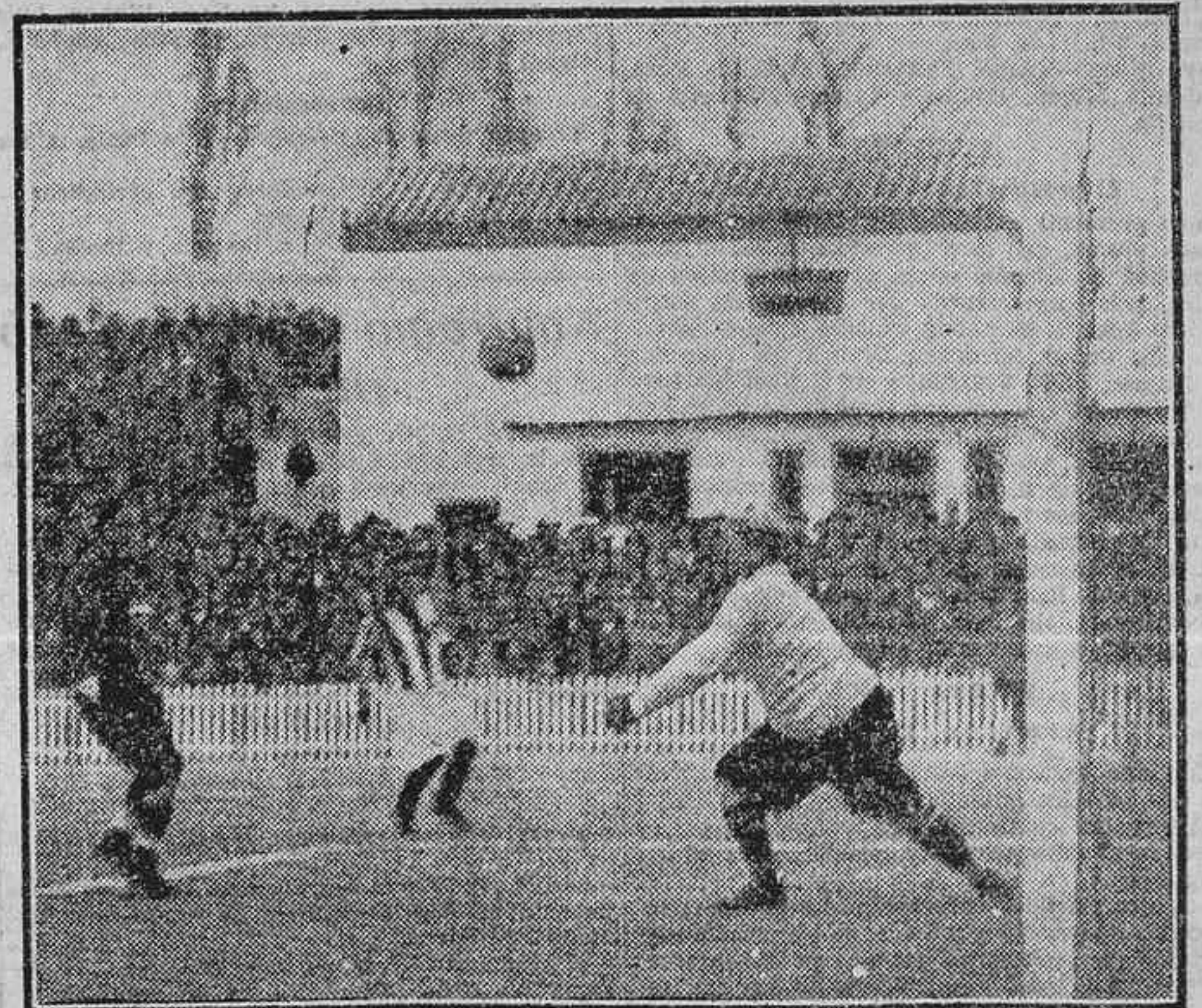
UN RECHACE DEL PORTERO UNIONISTA EN EL PARTIDO GIMNASTICA-UNION

Hoy, a las once de la mañana, darán comienzo las sesiones de la asamblea nacional, que re-