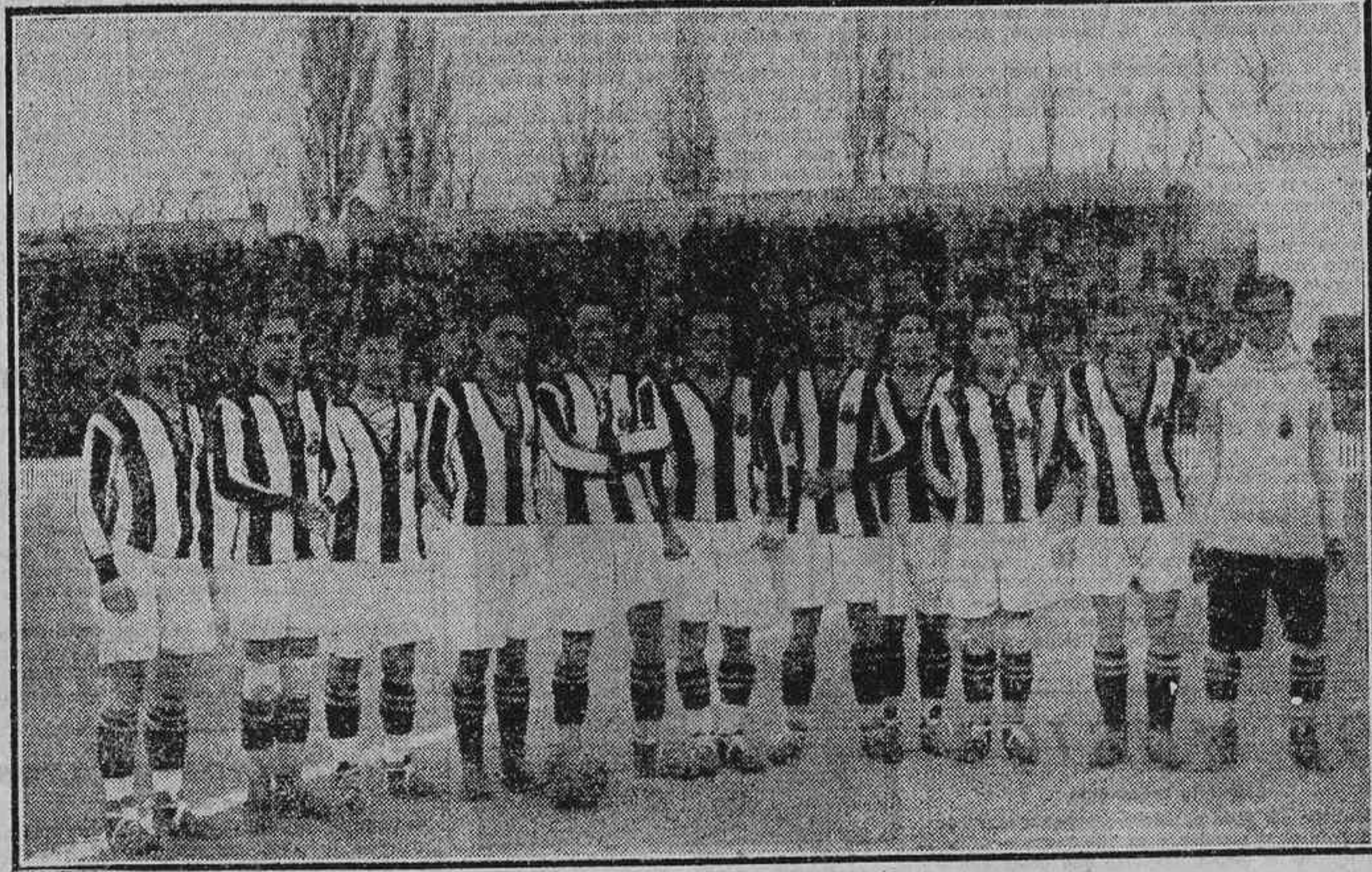
EL ONCE DE LA GIMNASTICA, QUE VA EN SEGUNDO LUGAR DEL CAMPEONATO REGIONAL

Dada la diferencia que existía entre los «once» del equipo gimnástico, y, como es natural, este