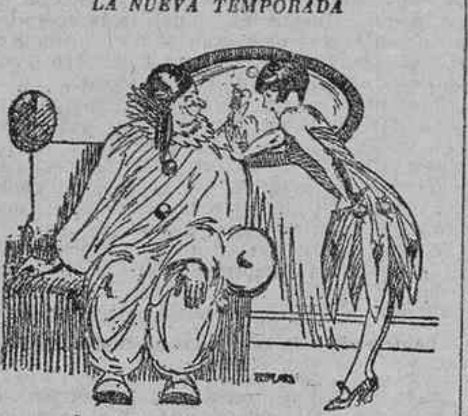
Ella.—¿Cómo encuentras este año a las maricas? —Pues como todo, hijita, más-caras... (London Opinion.)