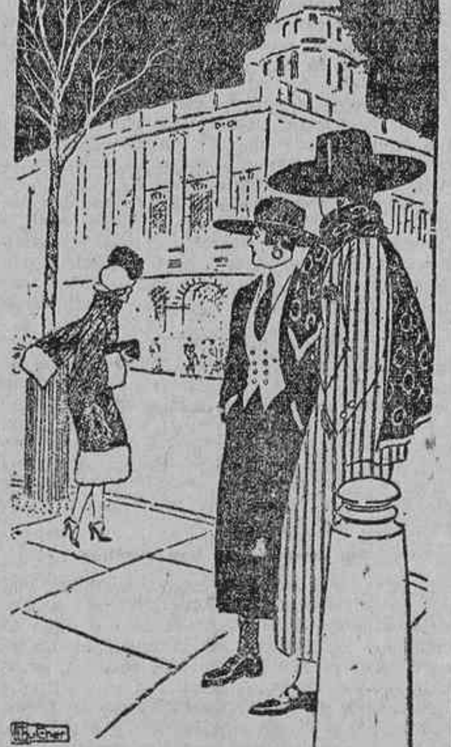
Una amiga a la otra.—¿Has visto a esa? ¡Qué modo de vestir tan afeminado! (London Mall.)