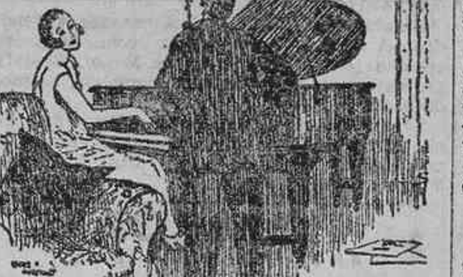
La dama.—¿Conoce usted esto? El compositor.—Nada, no sé. Ella.—Por Dios, si es la sinfonia de usted! El, sacudiendo la plancha.—¿Es que esas manos la transforman!... (London Mail.)