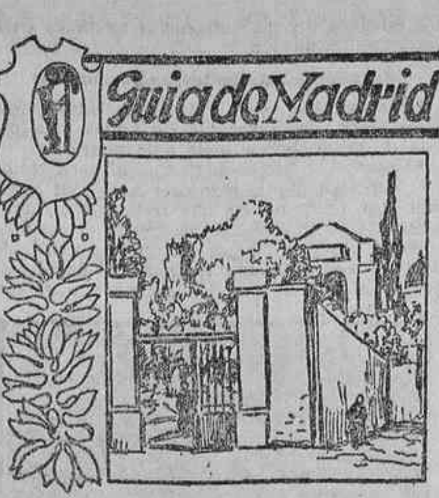
Carrera de San Isidro

En el año 1855 comenzaron las obras de ampliación de este cementerio, que desde su reforma había de llamarse de san Isidro, quedando aparte y en un nivel más profundo los tres patios del primitivo camposanto de San Pedro y San Andrés.