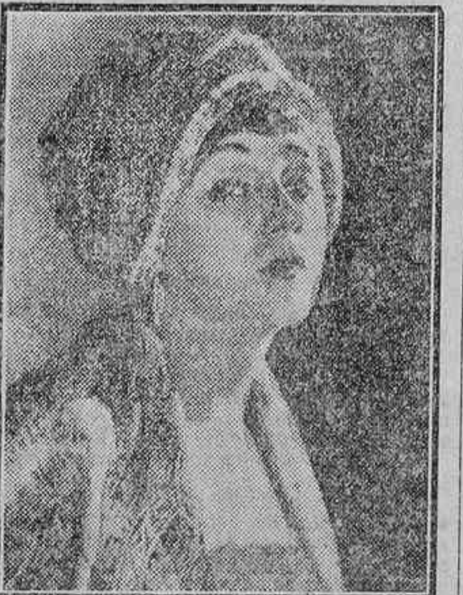
La gran estrella dramática Barbara La Mar

Con una combinación de fotografía y efecto escénico, peces submarinos nadan entre árboles de coral y enormes caracoles marinos. Hasta los humanos que toman parte en el baile submarino