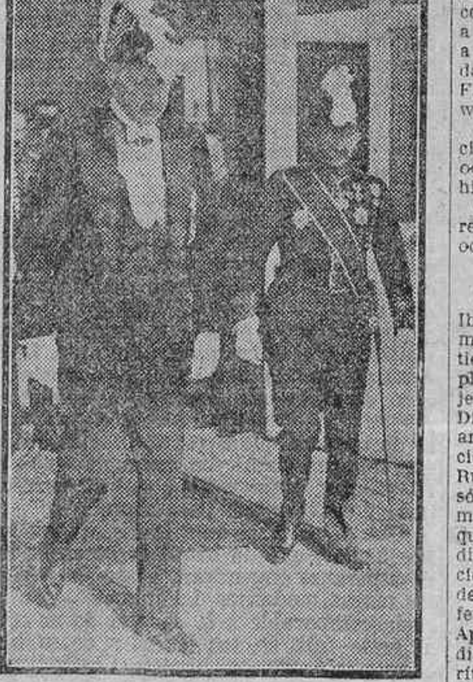
El nuevo ministro de Polonia, Mr. Ladislas Sobanski, saliendo de Palacio después de presentar sus credenciales