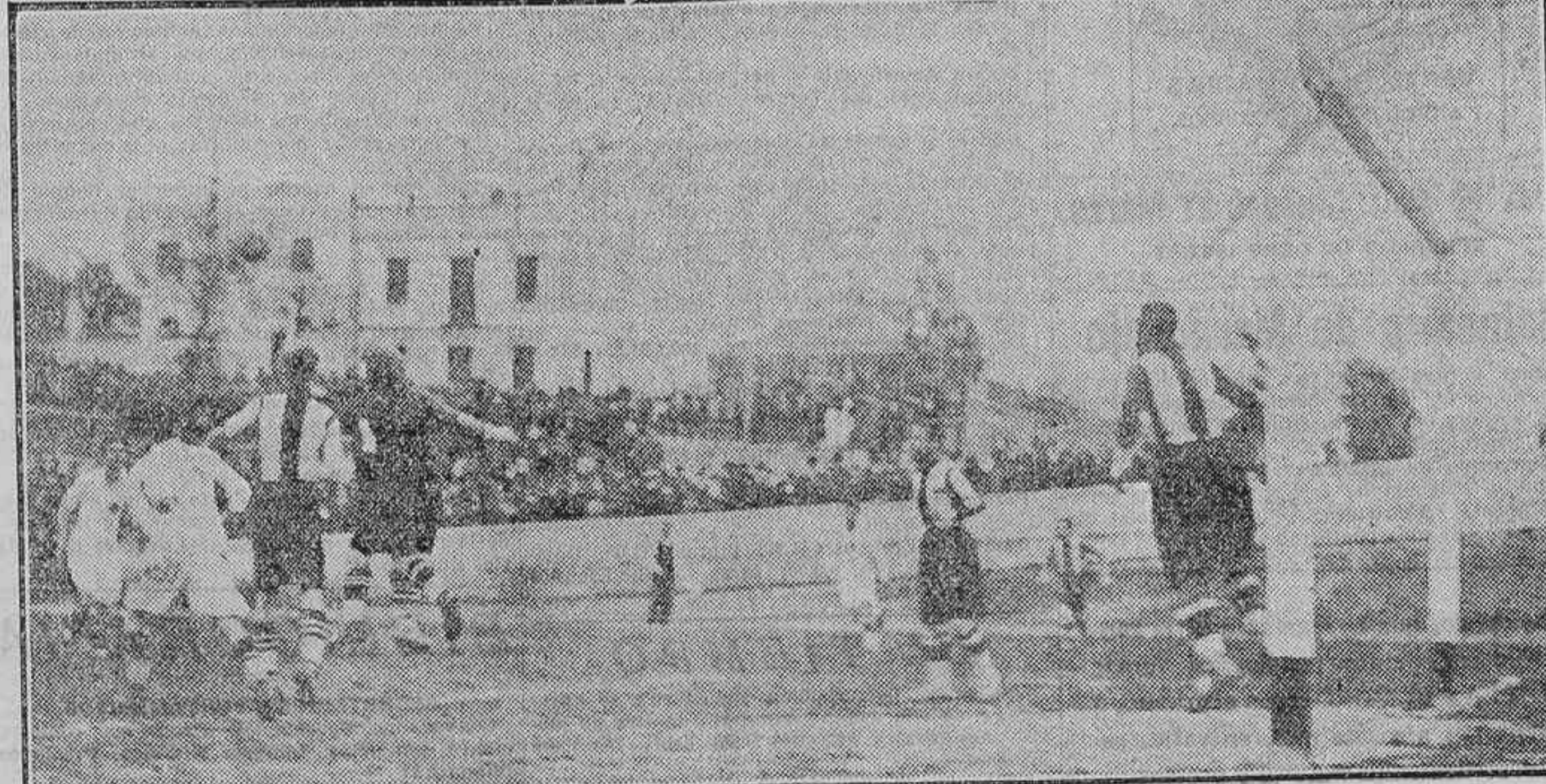
UN MOMENTO INTERESANTE DEL PARTIDO DE «FOOTBALL» JUGADO ANTEAYER ENTRE LOS EQUIPOS CLUB DE NATACION DE ALICANTE Y MADRID F. C.