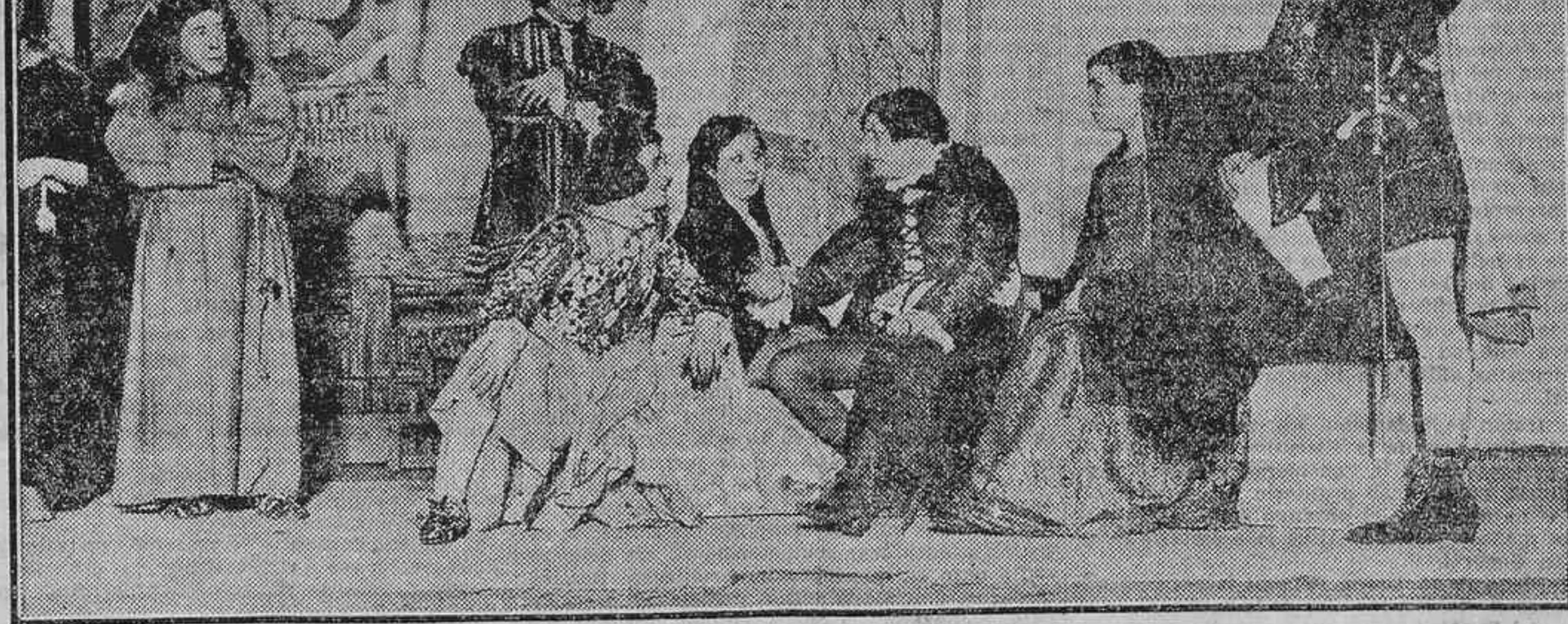
UNA ESCENA DE LA OBRA «EL CONDENADO POR DESCONFADO», DE TIRSO DE MOLINA, QUE REFUNDIDA POR LOS HERMANOS MACHADO SE ESTRENO ANOCHÉ EN EL TEATRO ESPAÑOL