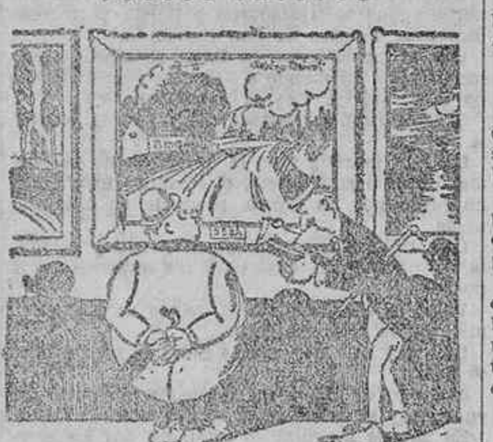
«¡Da pena! Malgastar tanta tela cuando tantos pobres diablos no tendrán camisa que ponerse!»