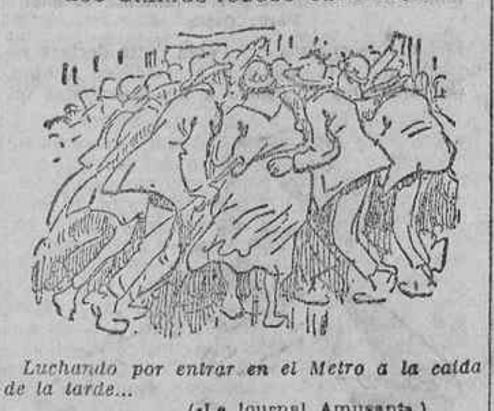
Luchando por entrar en el Metro a la caída de la tarde...