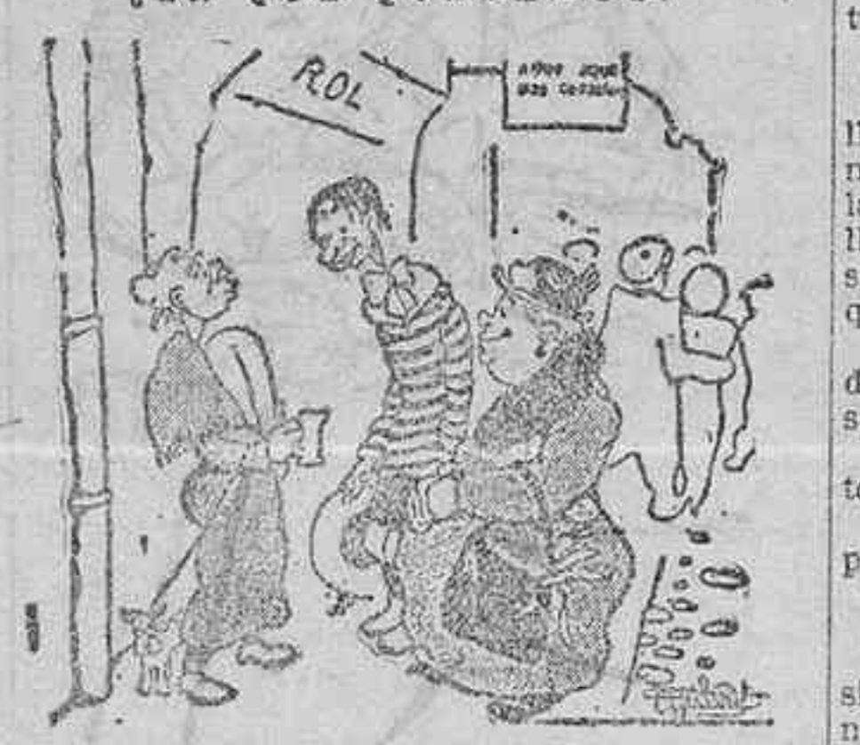
«¿Es este vuestro chico? -Este, señora Alfonso. -Madre de Dios, ¡qué grande!»