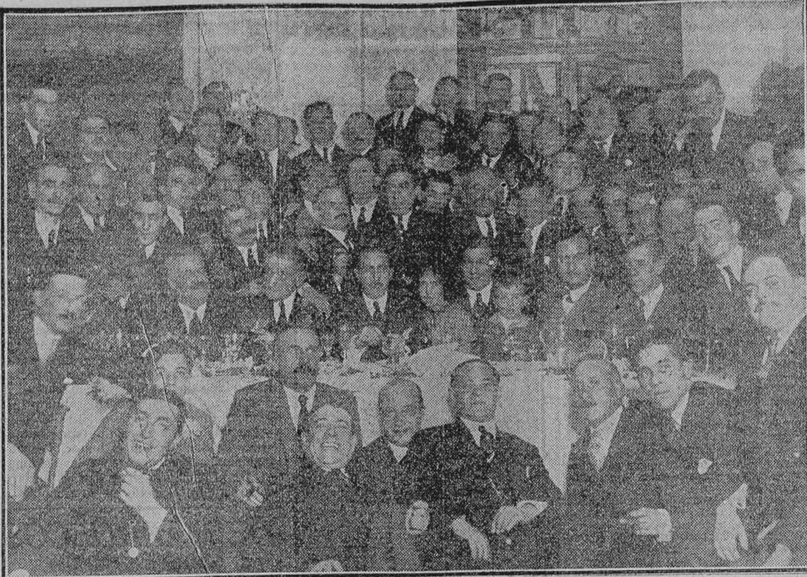
EL DIESTRO GITANILLO, ROBEADO DE AMIGOS Y ADMIRADORES, AL TERMINAR EL BANQUETE CON QUE ESTOS LE OBSEQUIARON POR SU BRILLANTE ACTUACION EN LA ULTIMA TEMPORADA

Una vez terminada la ceremonia los invitados se trasladaron al Hotel Ritz, en donde fueron obsequiados con un té.