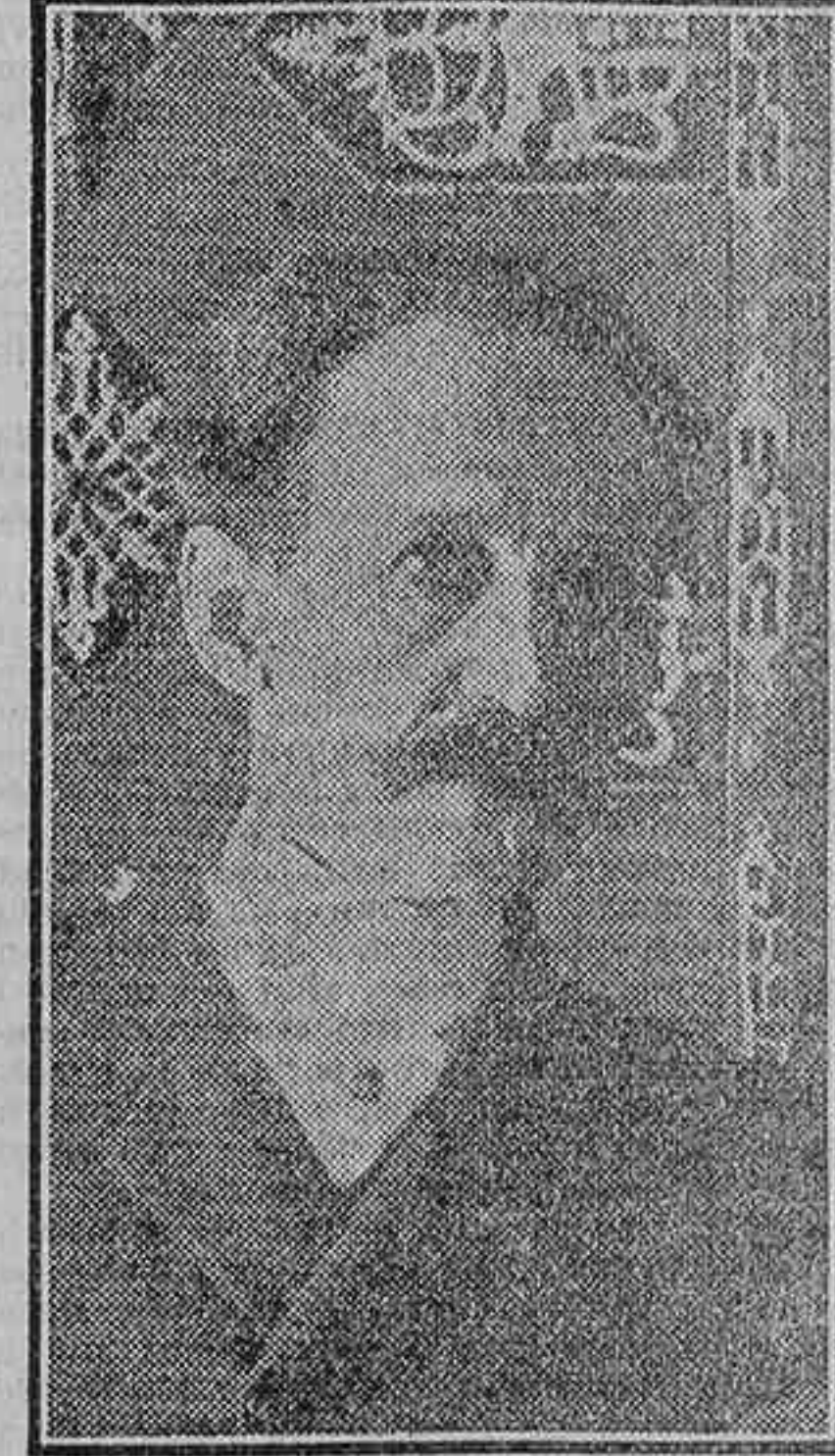
Jacinto Octavio Picón

Desde las primeras horas de la mañana fueron cubriéndose de firmas las listas colocadas en la docta Corporación. Era Picón novelista y crítico literario y de