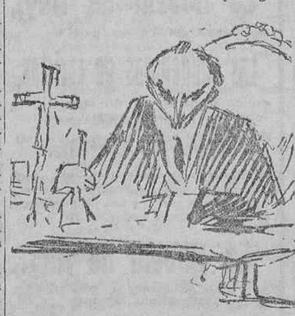
Melquíades Álvarez en el sillón presidencial

Pide al ministro de la Guerra que diga lo