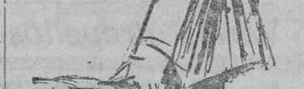
Indalecio Prieto ofrece el puesto de la Comisión para algún voluntario

El ministro de la GOBERNACION contesta que el Gobierno está dispuesto a hacer lo que pueda en auxilio de los damnificados. Hoy no hay fondo de calamidades; pero