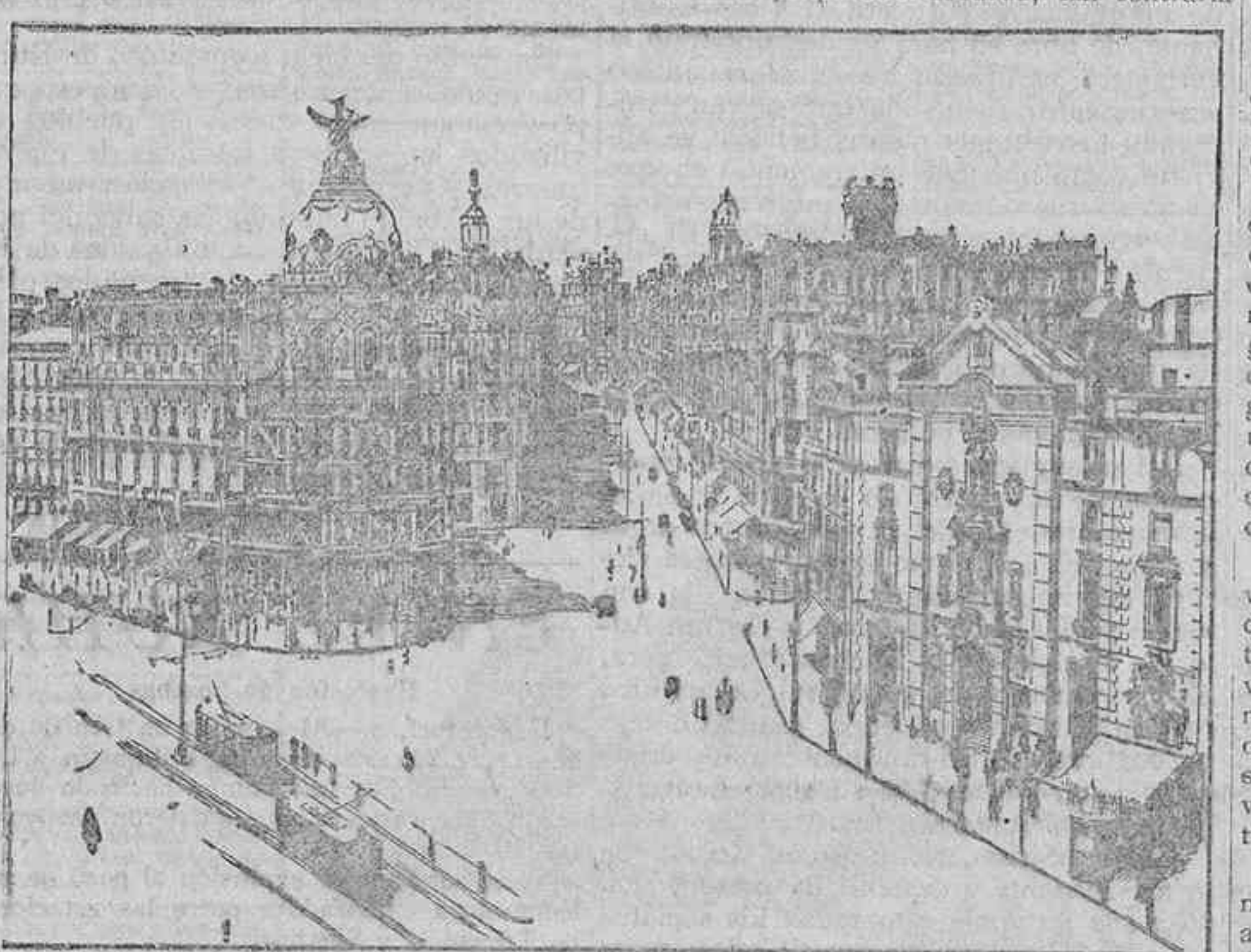
GRAN VÍA.—Avenida del Conde de Peñalver

Por cierto que viene aquí, como anillo al dedo, un reparo que fuera de desear tuviese acogida favorable donde puede surtir sus efectos: la desproporción absurda, tan contraria