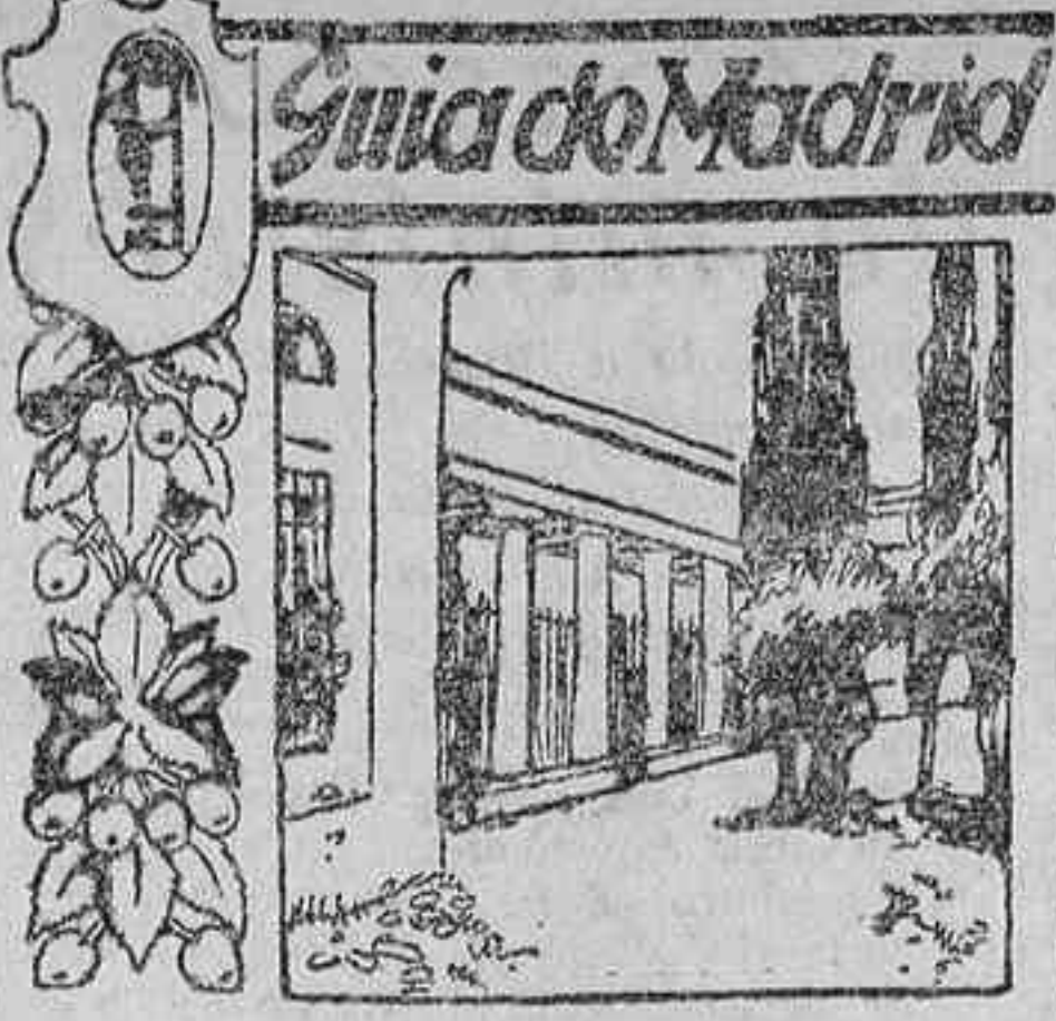
Calle de Magallanes

La operación ha sido muy delicada. El herido quedó después de la operación en estado satisfactorio, y en cuanto la mejoría se acuerde será trasladado a la clínica particular del doctor Corrachá.