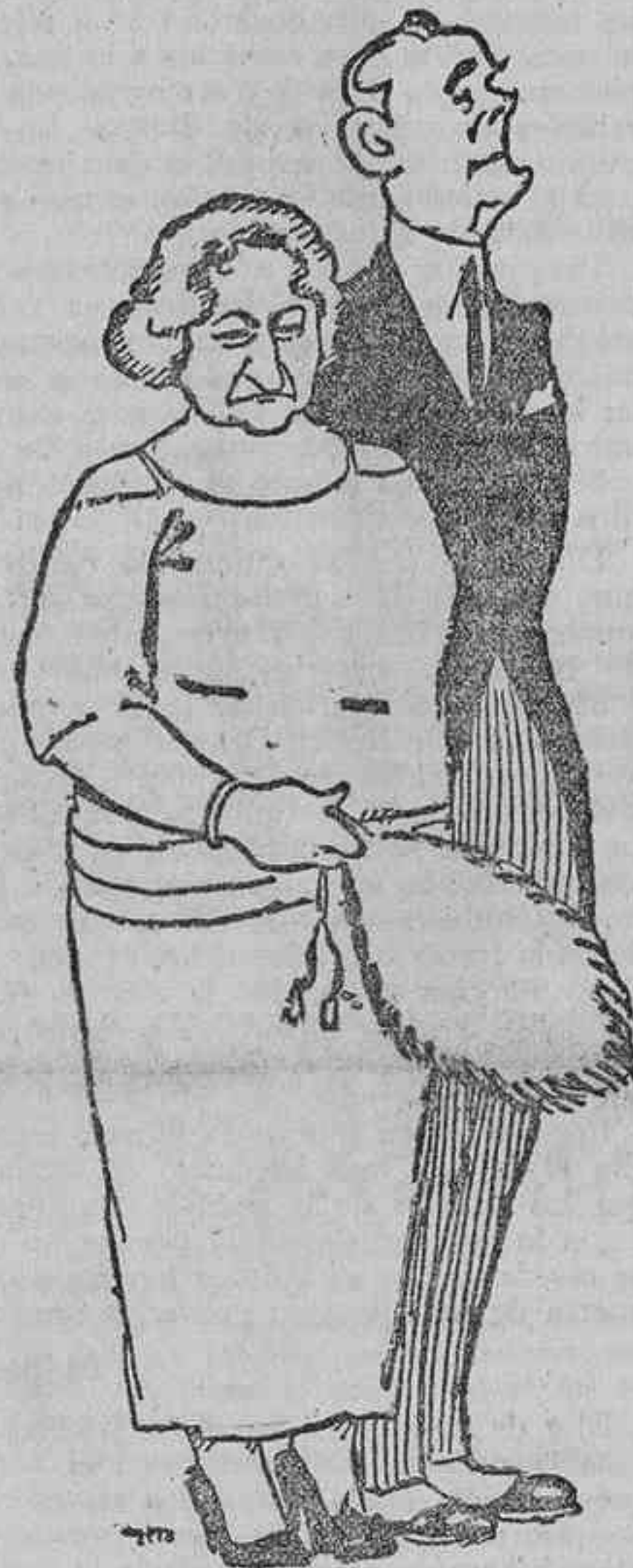
En ambos mundos resuena de estos artistas la fama, a quienes el pueblo aclama cual príncipes de la escena.