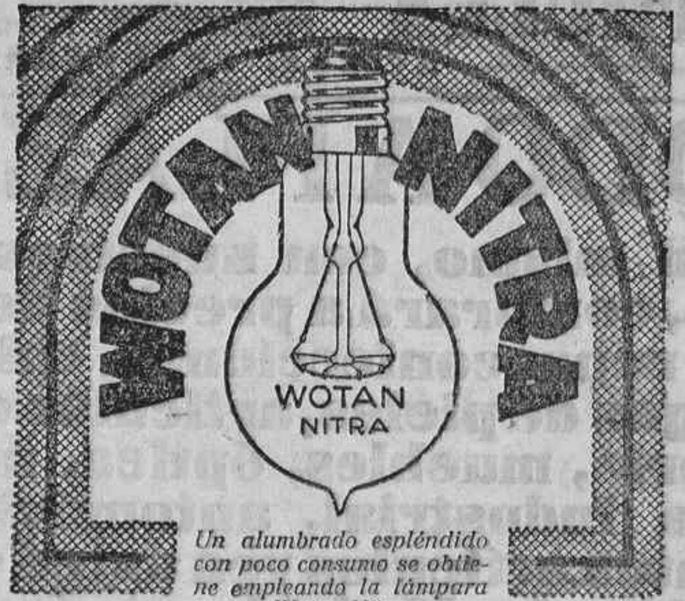
Un alumbrado espléndido con poco consumo se obtiene empleando la lámpara Wotan-Nitra.

KURSAAL DE LA MAGDALENA, Magdalena, 30.—Secciones de variedades de siete