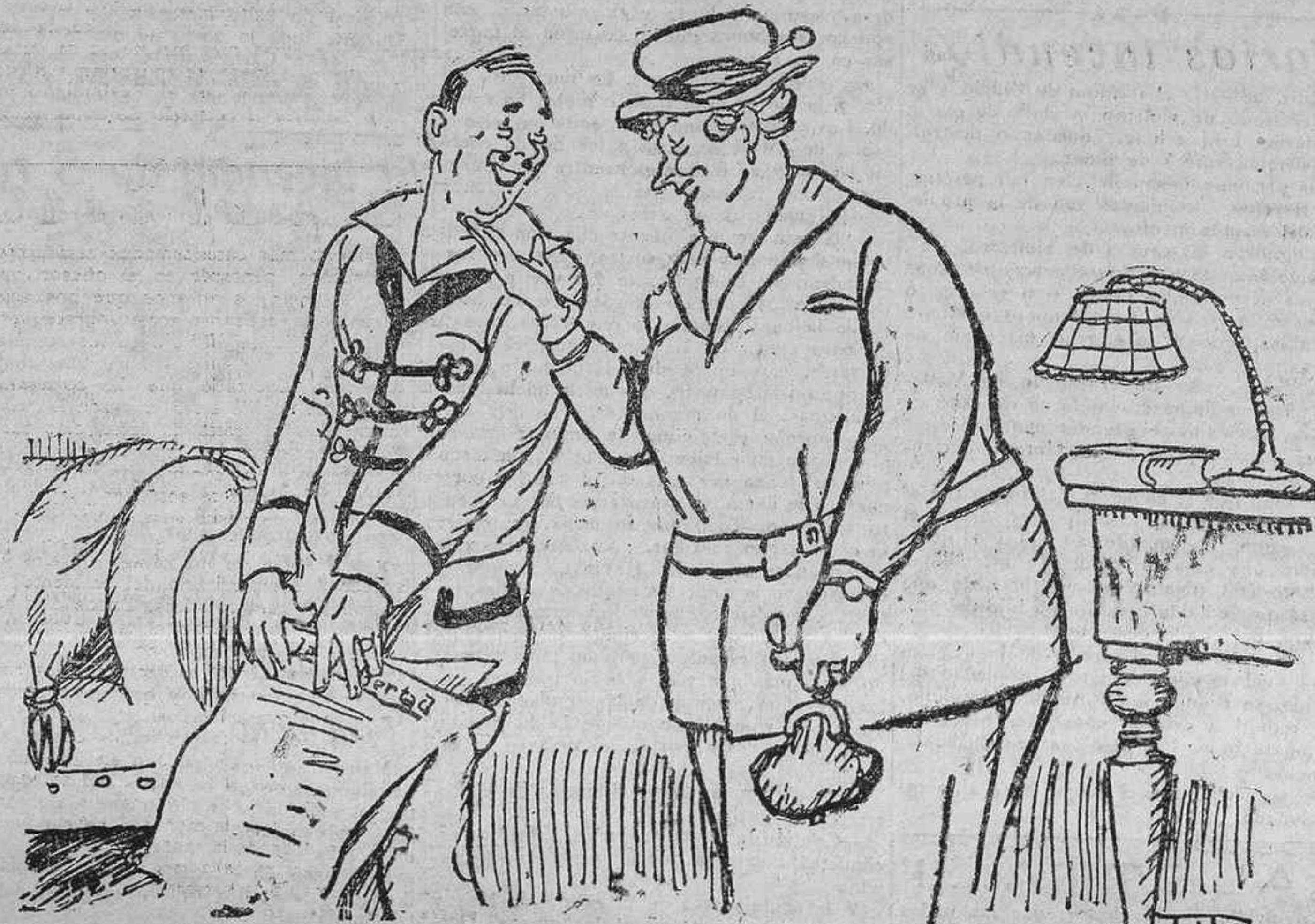
LA SEÑORA POLICIA.—¡Ladrón!...