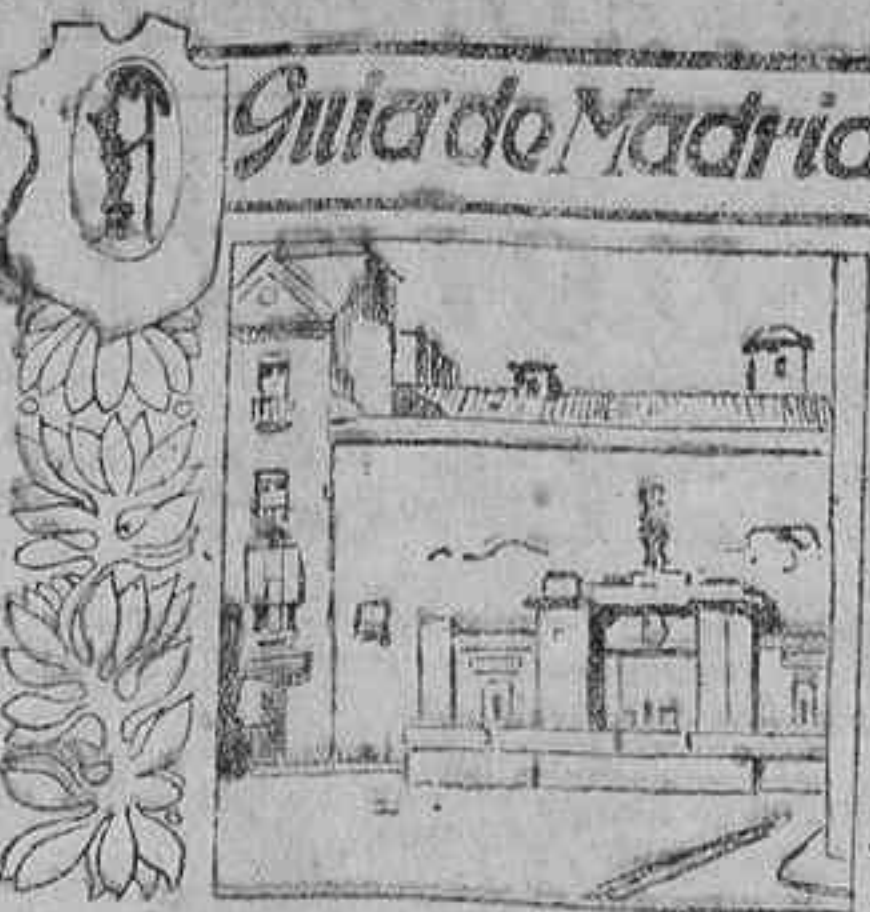
Calle de la Cruz del Rayo

El Sr. Sánchez Guerra escuchó atentamente y con visible interés cuanto le fué expuesto, ofreciendo dar cuenta de ello en Consejo de ministros, y elogió la justa causa que se defendía en favor de las clases inferiores de la Administración.