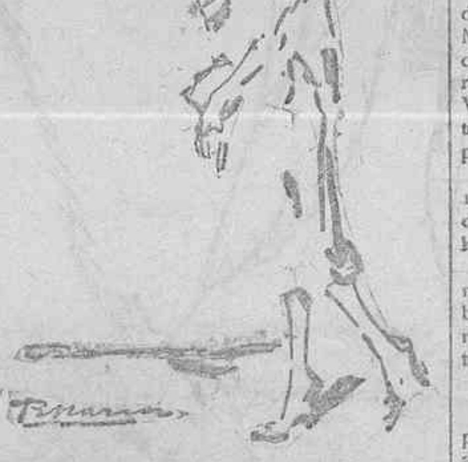
Una madriena con la clásica mantilla

Después iban los «pasos» titulados «La Cena», «Oración del huerto», «Bezo de Judas», «Cristo atado a la columna», «Ecco homo», «Jesús Nazareno», «La Verónica», «La