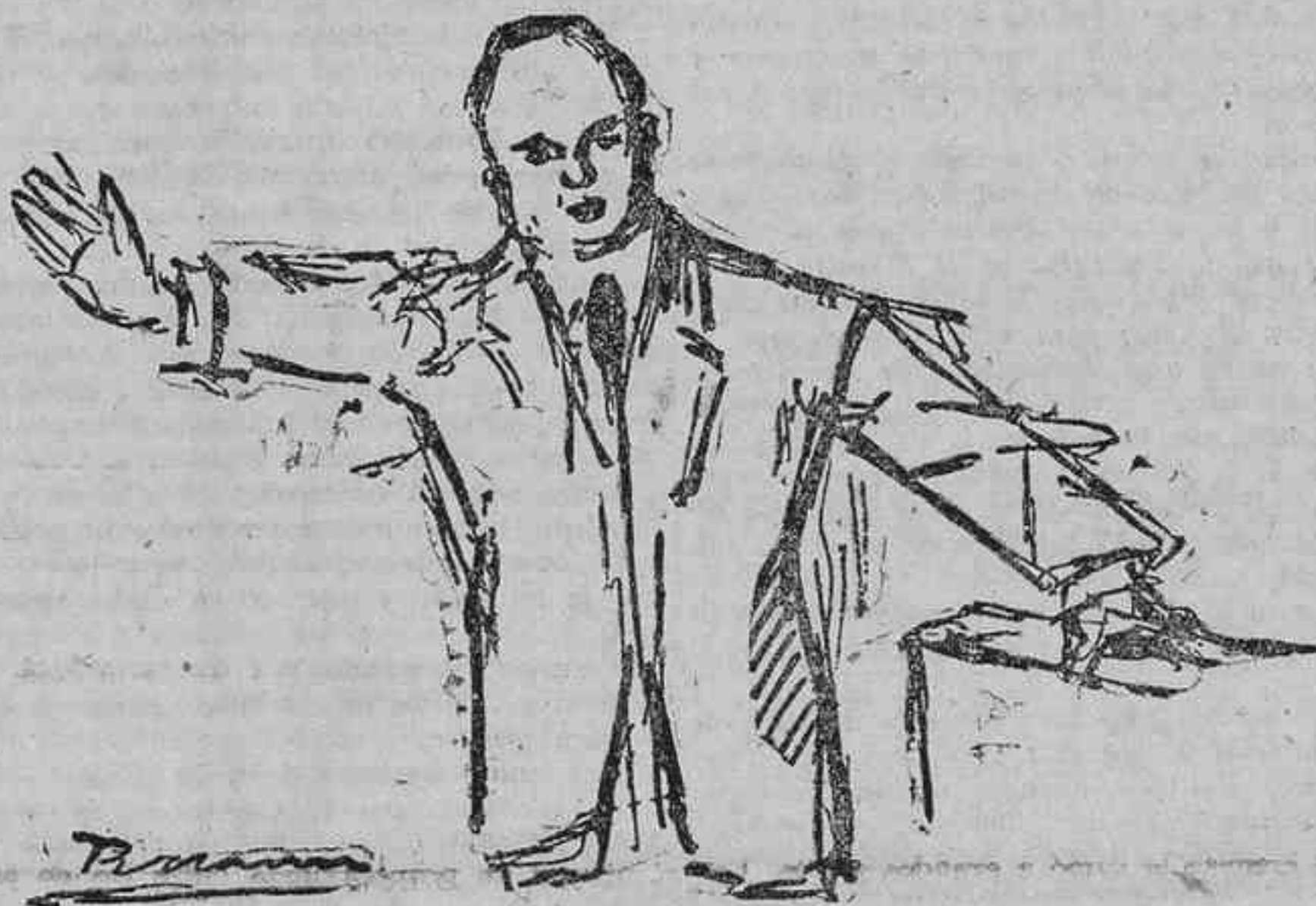
INDALECHO PRIETO IMPUGNANDO EL ARANCEL