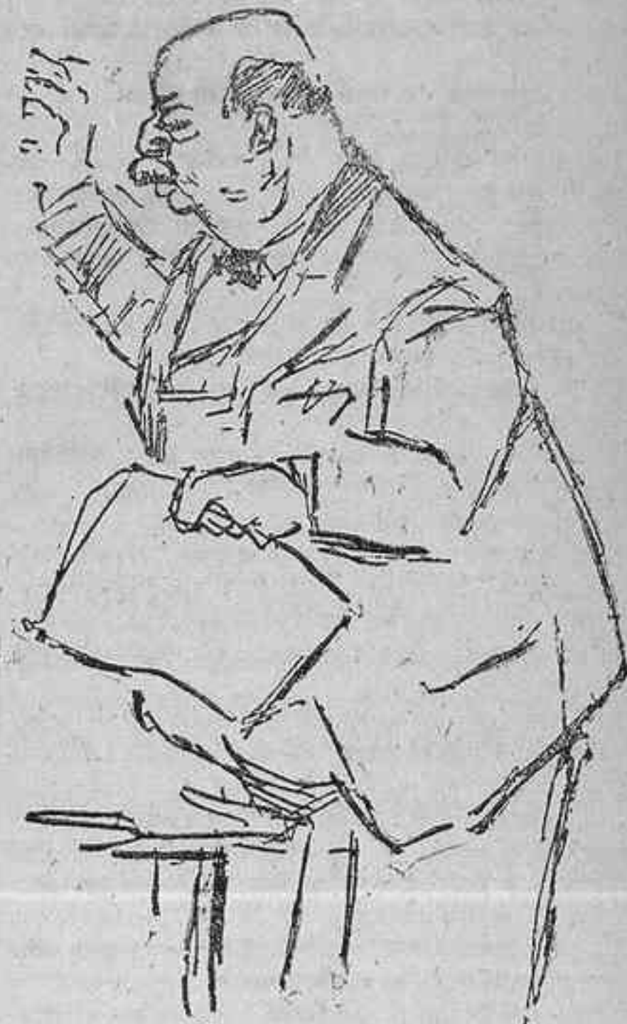
Nougues en su regocijada fiscalización

Hay la costumbre de venir con testimonios de cadáveres más o menos gloriosos, y ayer