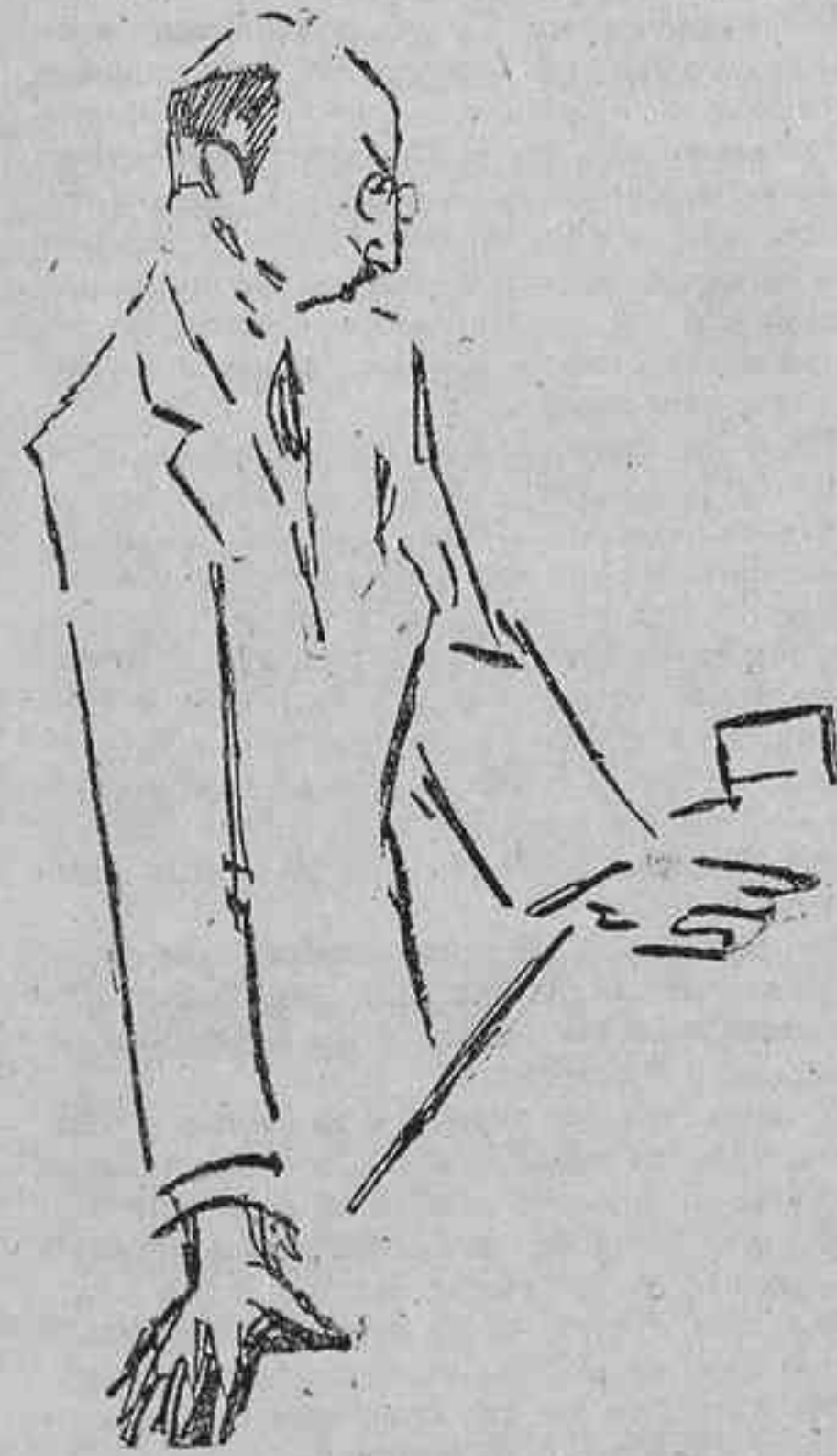
El marqués de Lema aplastado por Ortega y Gasset

El Sr. Solano interpelló al Gobierno sobre los atropellos de que se había hecho víctima