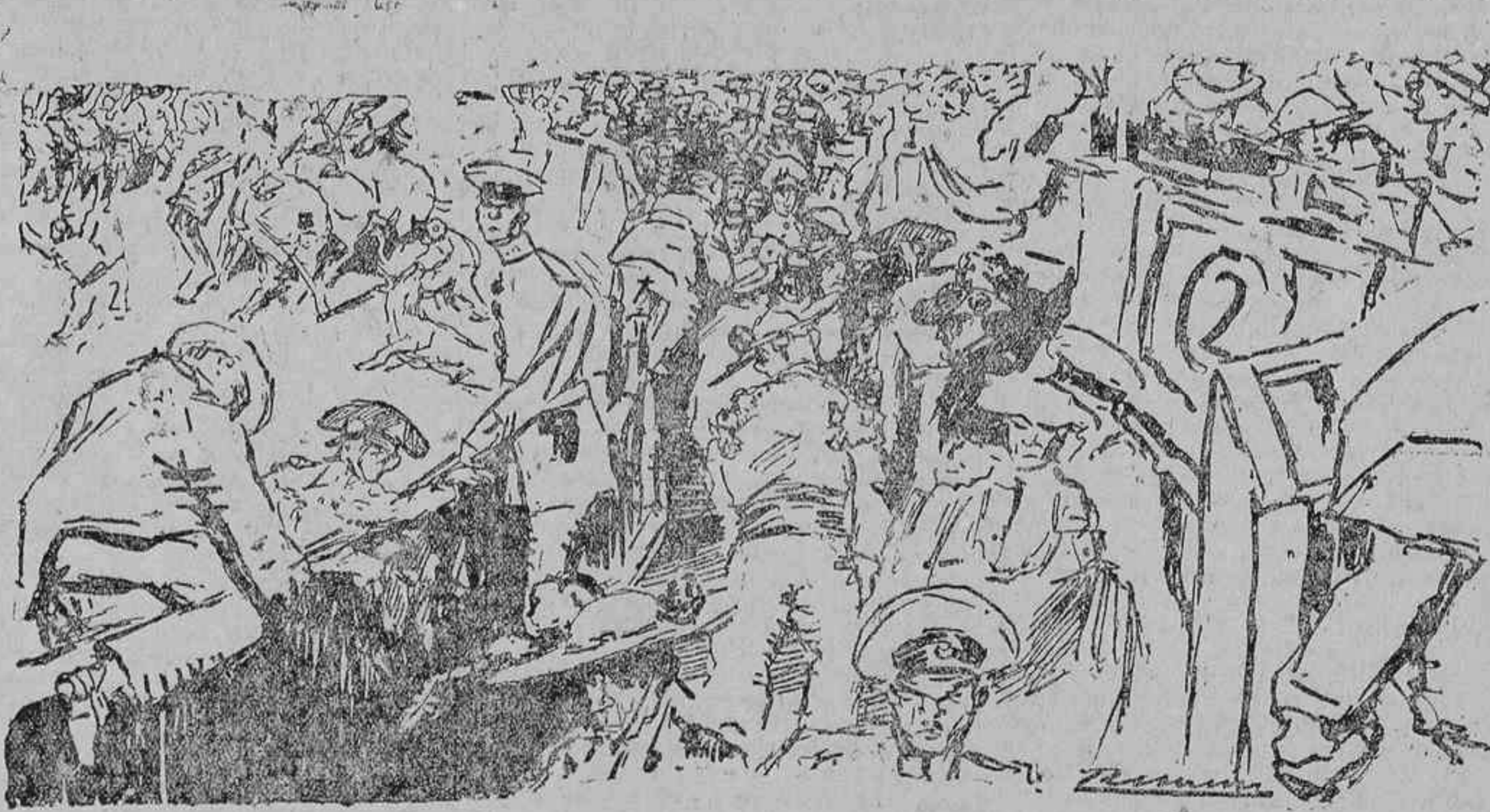
ENORME ESCANDALO DURANTE LA LIDIA DEL SEGUNDO NOVILLO

El toro llegó a la muerte bravísimo y codicioso. Mariano cogió la muleta con la izquierda y paso a paso llegó a la cara del de Palmella, inaugurando la labor con un