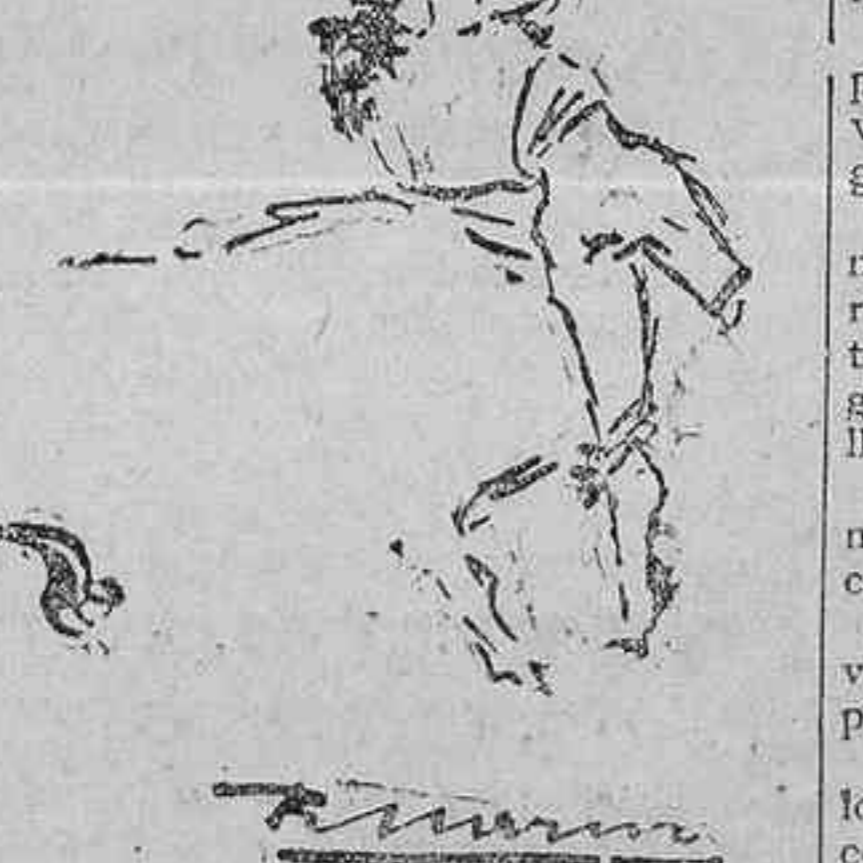
Barajas en el enorme volapié al mismo toro