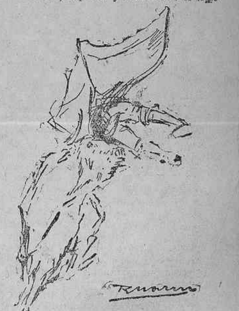
Cogida de Gitanillo en su primer toro