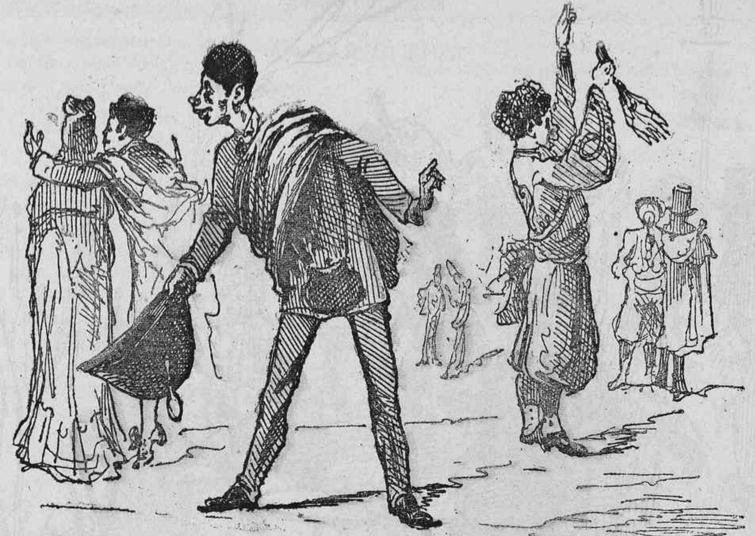
LA PLAGA.—Diálogos cogidos al vuelo.

—Mira el matrimonio del principal. —De qué van vestidos? —Con arreglo á su conciencia.