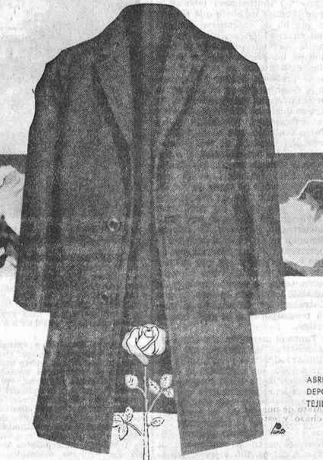
ABRIGOS, TRINCHERAS, CHAQUETAS, PRENDAS DEPORTIVAS EN GENERO DE PUNTO Y EN TEJIDO DE LANA, SEDA, ALGODON Y NYLON