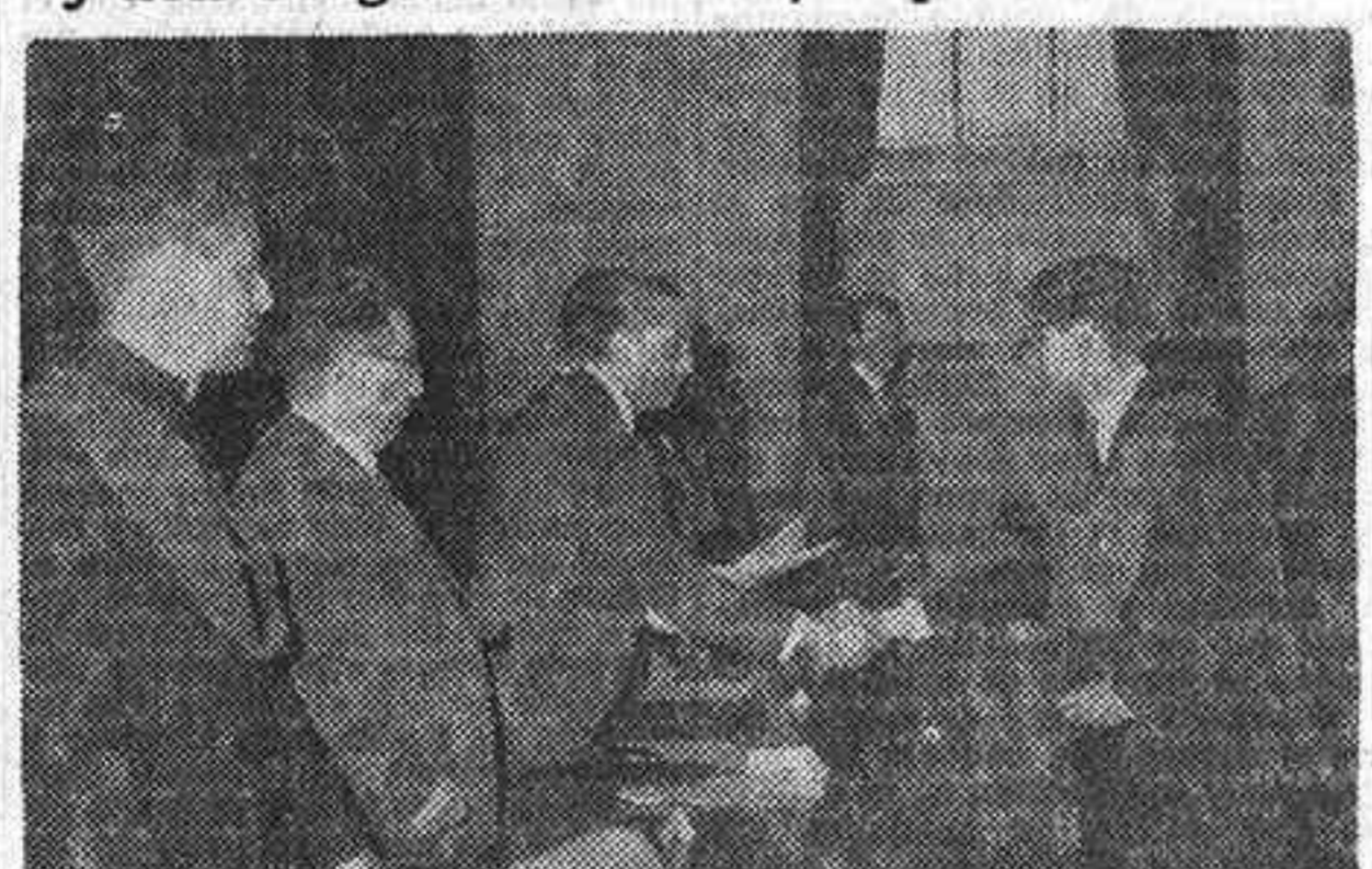
Momento de la investidura de dignidades colegiales durante el acto inaugural del curso en el Colegio Hispanoamericano Nuestra Señora de Guadalupe...

Presidieron el ministro, representado por el presidente del Consejo Nacional de Educación, y don Gregorio Maraón, respectivamente