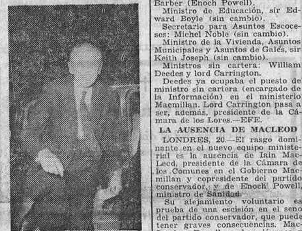
Lord Home, sucesor de Macmillan como "premier", llega al lugar donde se celebró la larga y definitiva reunión destinada a perfilar la formación del nuevo Gobierno británico. El papel que lleva en la mano contiene la lista de los ministros

LONDRES, 20. — Lord Home, el nuevo jefe del Gobierno británico, ha anunciado la lista de su Gabinete después de intensas consultas con los más destacados ministros en los días de ayer y hoy. Una muchedumbre permanecía, bajo la lluvia, atenta a las salidas y entradas en el número 10 de Downing Street. Lo más destacado en el nuevo Gobierno es el cambio de puesto de cuatro ministros de Macmillan y la elevación al rango de ministros del Gabinete de cuatro personalidades que antes no eran miembros de él. El nuevo Gabinete totaliza 23 miembros, frente a 21 bajo Macmillan y su edad media es de cincuenta y un años y dos meses, mientras que para el equipo gubernamental de Macmillan era de cincuenta y un años y un mes.