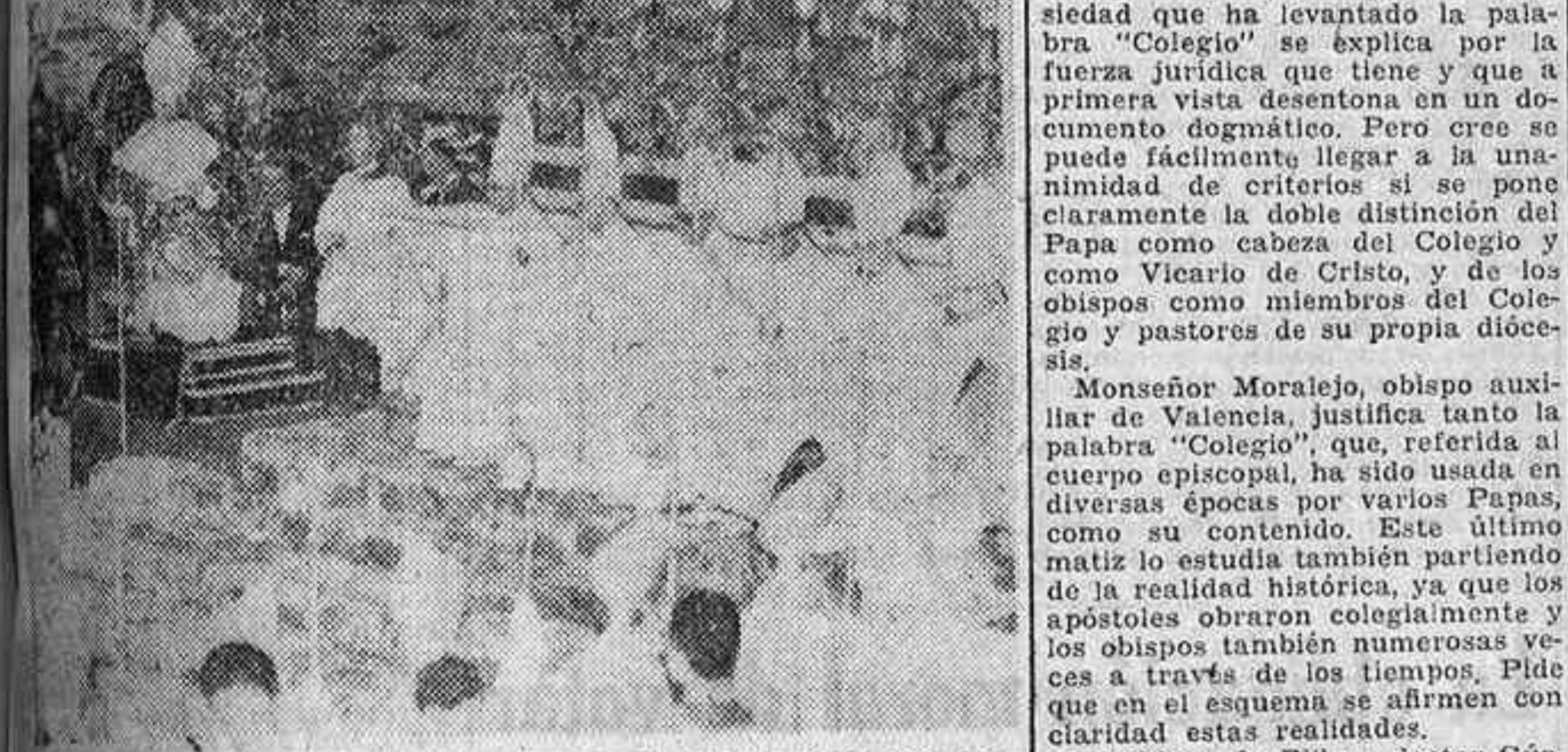
Su Santidad Pablo VI da lectura al mensaje que ha dirigido a los catorce nuevos obispos misioneros consagrados por él en la mañana del domingo.

SU SANTIDAD CONSAGRO AYER A CATORCE OBISPOS MISIONEROS