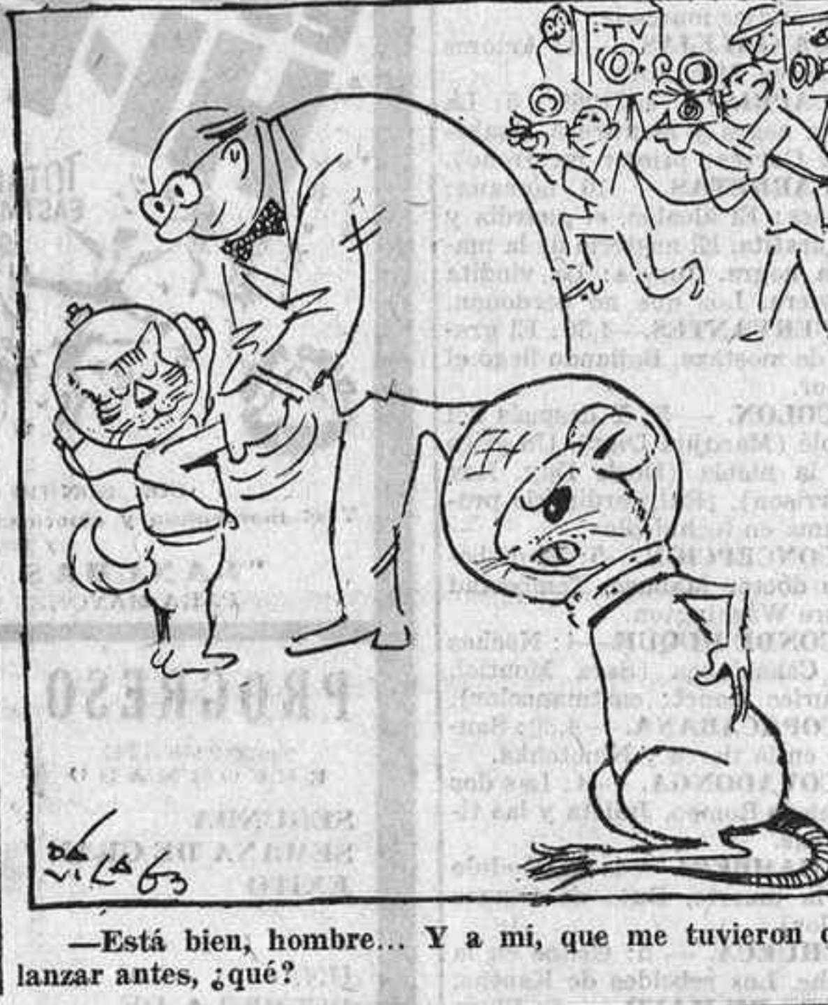
—Está bien, hombre... Y a mí, que me tuvieron que lanzar antes, ¿qué?