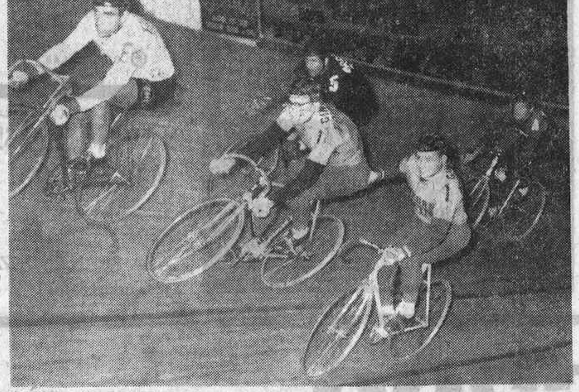
Esta fotografía revela uno de los clásicos relevos que se efectúan en las carreras de los Seis Días, competición que dará comienzo, en su cuarta edición, el 29 del presente mes hasta el día 4 del próximo noviembre.