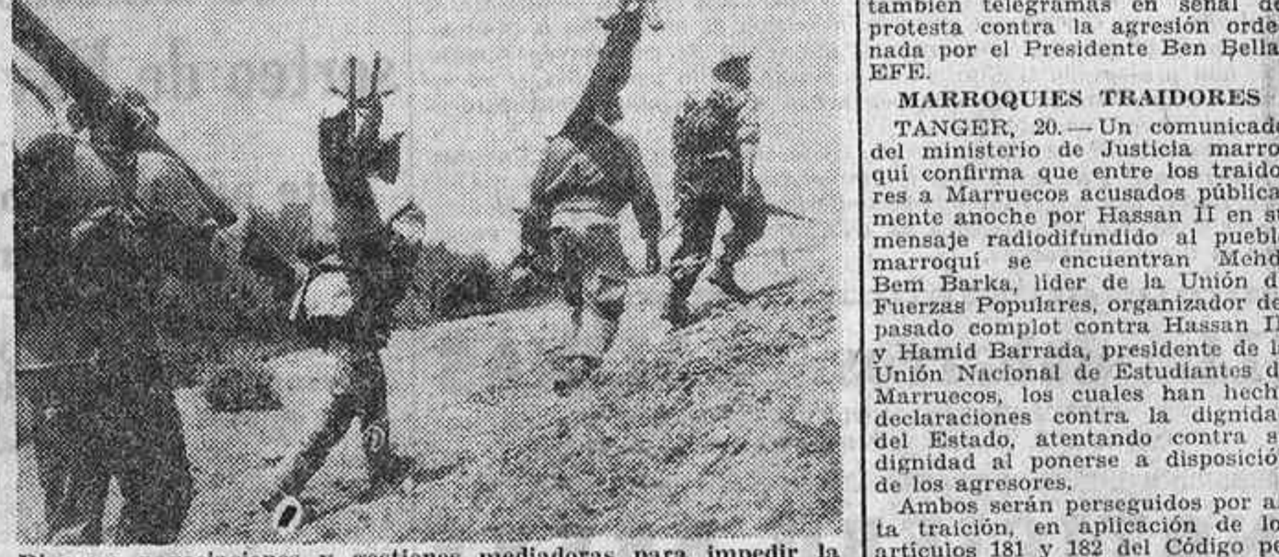
Diversas negociaciones y gestiones mediadoras para impedir la extensión de la lucha entre Marruecos y Argelia no han dado hasta la fecha resultado positivo, aunque tampoco se descarta de manera definitiva la posibilidad de un arreglo. No obstante, ambas partes prosiguen el despliegue de tropas, que siguen combatiendo en la zona disputada. En la foto aparece un grupo de soldados argelinos transportando las piezas de un cañón para emplazarlo en una posición próxima al escenario de los combates.

Cinco oficiales egipcios capturados por los marroquíes a bordo de un helicóptero