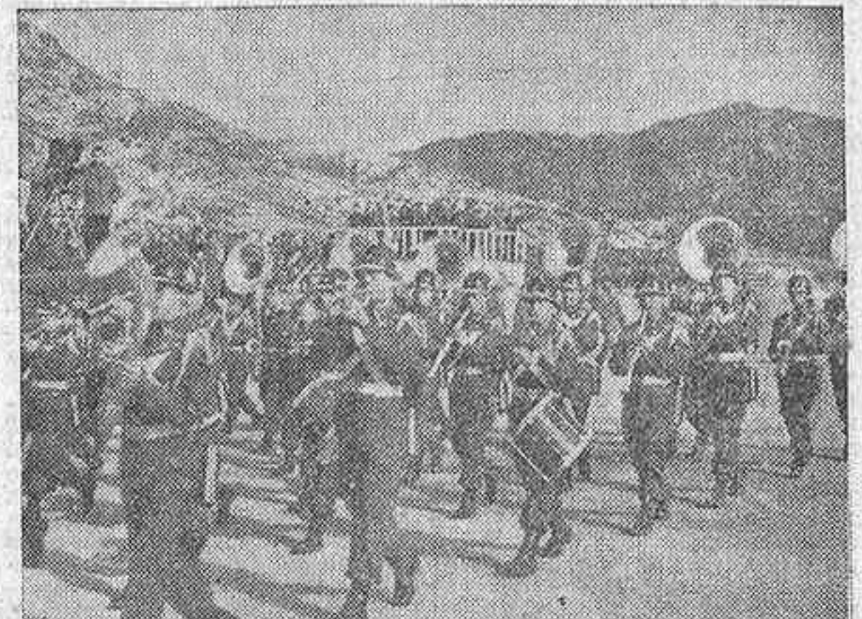
En Fusun, y desde una tribuna, el Presidente de la República de Corea del Sur presencia el desfile de la nueva Academia Militar, precedida por su banda de música.

Los delegados rojos insisten en que Rusia forme parte de la Comisión neutral inspectora de la tregua