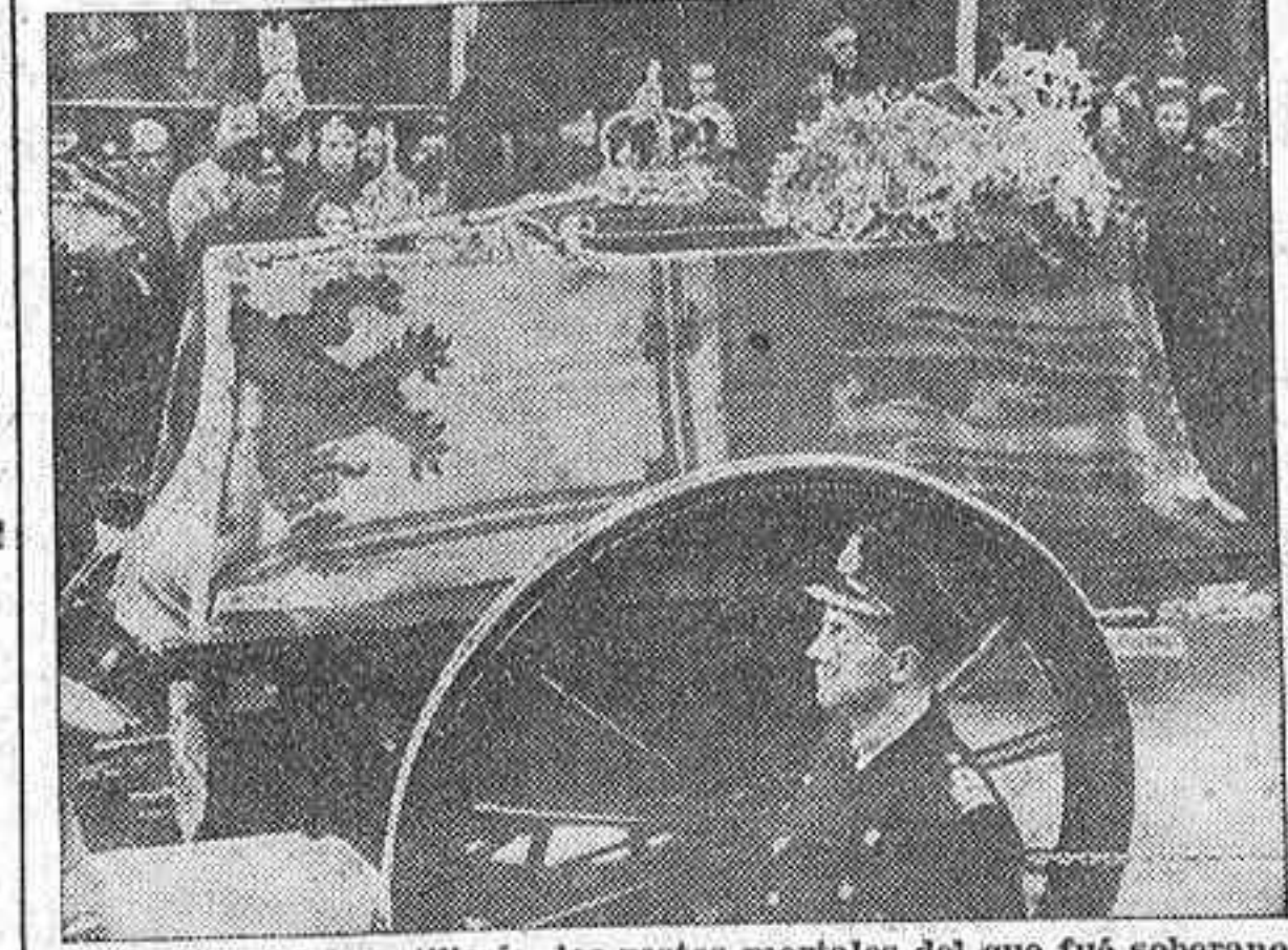
En un arnés de artillería, los restos mortales del que fué soberano de la Gran Bretaña cruzan las calles de Londres, camino del lugar del eterno descanso. Sobre el féretro cubierto por el estandarte real, la ofrenda de flores de la reina Mary, con la corona, el cetro y la esfera, atributos de la Monarquía.

Ha sido reducido el periodo de duelo de la corte y de la nación por la muerte de Jorge VI