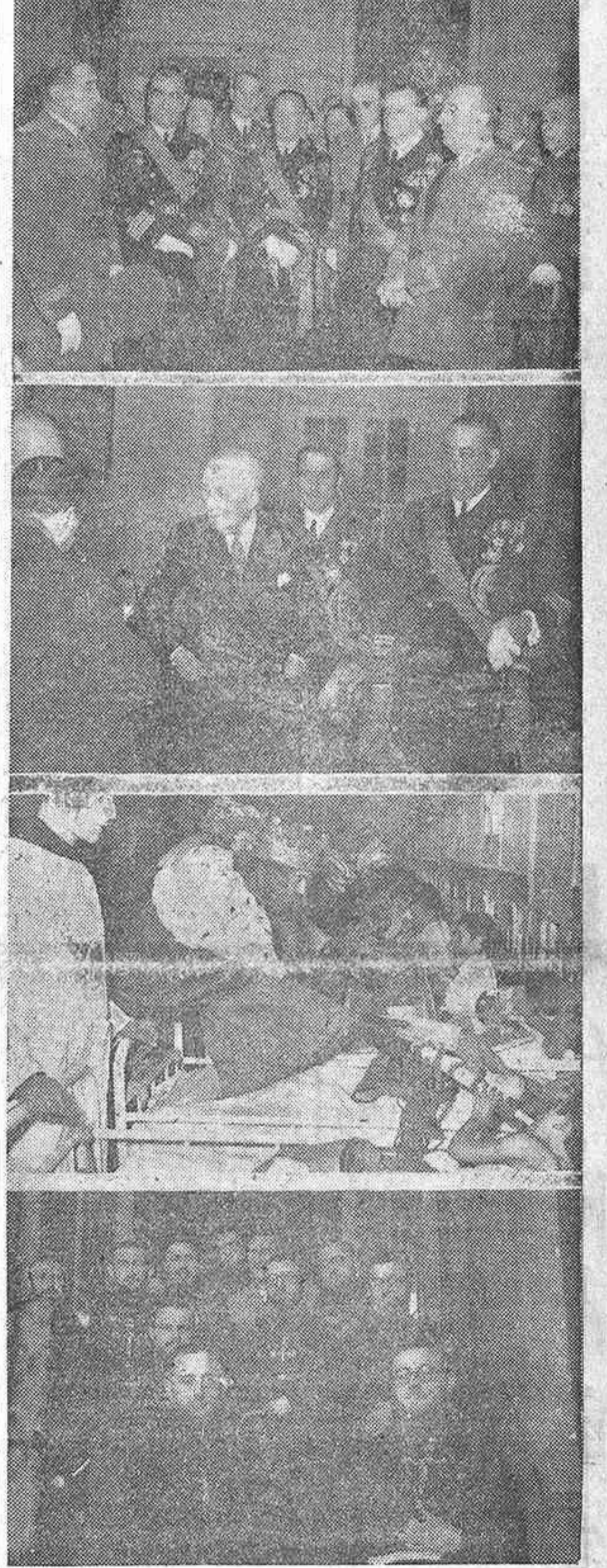
En el día de ayer, festividad de los Reyes, se celebraron diversos actos que ofrecieron distintas facetas de profunda emoción, de los que son una muestra estas fotos, en las que vemos, de arriba abajo: en la primera, a Su Excelencia el Jefe del Estado rodeado de la comisión de generales de las tres Armas que acudieron al palacio de El Pardo, presididos por el ministro del Ejército, teniente general Muñoz Grandes, a cumplimentarle con motivo de la Pascua militar; en la segunda foto, el almirante de más edad de la Armada, marqués de Magaz, recibe los comisionados de la Marina de Guerra que le felicitaron por el mismo motivo; la tercera foto recoge el momento en que los Reyes Magos de la cabalgata organizada por Radio Nacional obsequia con lotes de juguetes a los pequeños acogidos en el asilo de San Rafael, y la última foto nos presenta a un grupo de los 15 misioneros capuchinos y franciscanos a quienes se les tributó un homenaje de despedida en el cine Metropolitano, haciéndoseles entrega de sendos crucifijos, con motivo de su próxima partida para la zona septentrional de Venezuela.