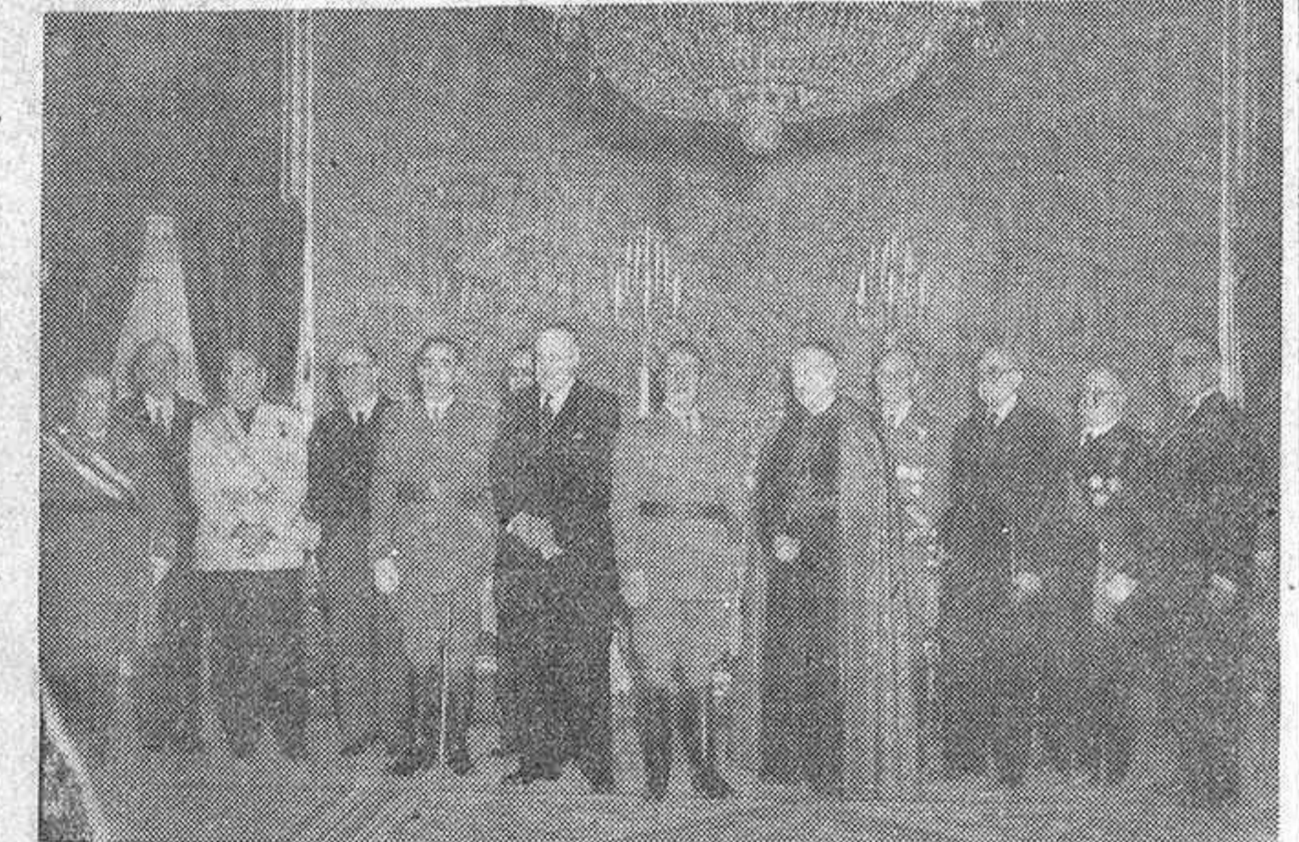
Con motivo del año nuevo, el Consejo del Reino, presidido por don Esteban Bilbao, acudió al palacio de El Pardo para cumplimentar a Su Excelencia el Jefe del Estado, a quien vemos en esta foto acompañado por las personalidades que integran dicho alto organismo.

"GRACIAS A DIOS Y AL TESON DE LOS ESPAÑOLES, COMENZAMOS A VER EL SOL DE NUESTRA ESPERANZA", DIJO EL JEFE DEL ESTADO