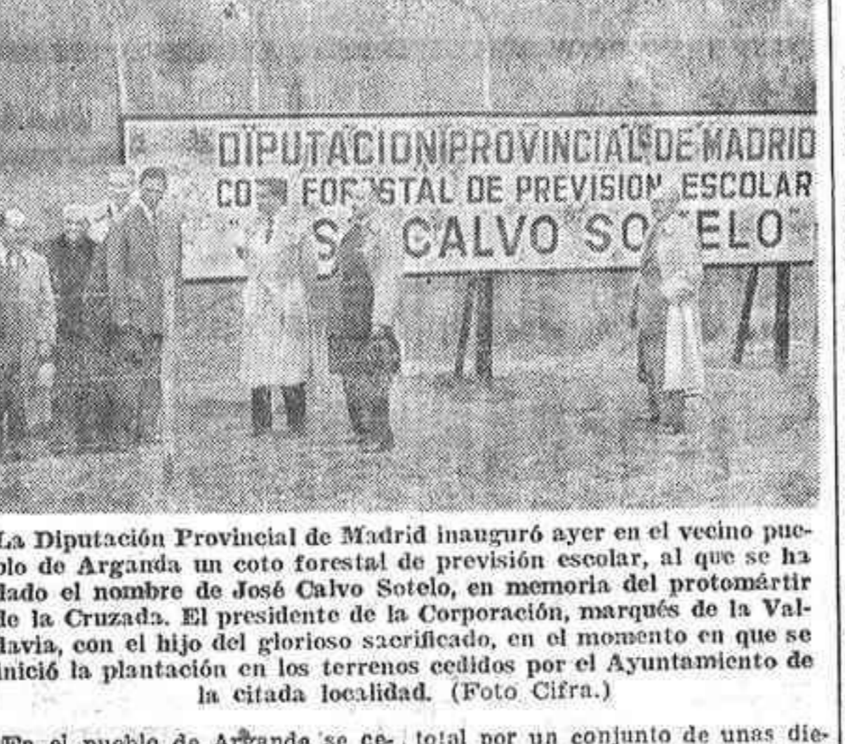
DIPUTACION PROVINCIAL DE MADRID COTO FORESTAL DE PREVISION ESCOLAR CALVO SOTELO

Asistieron al acto el presidente de la Diputación y el hijo del protomártir