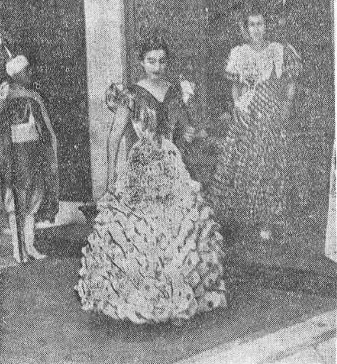
Durante su permanencia en Sevilla, los marqueses de Villaverde han honrado con su presencia el real de la feria...