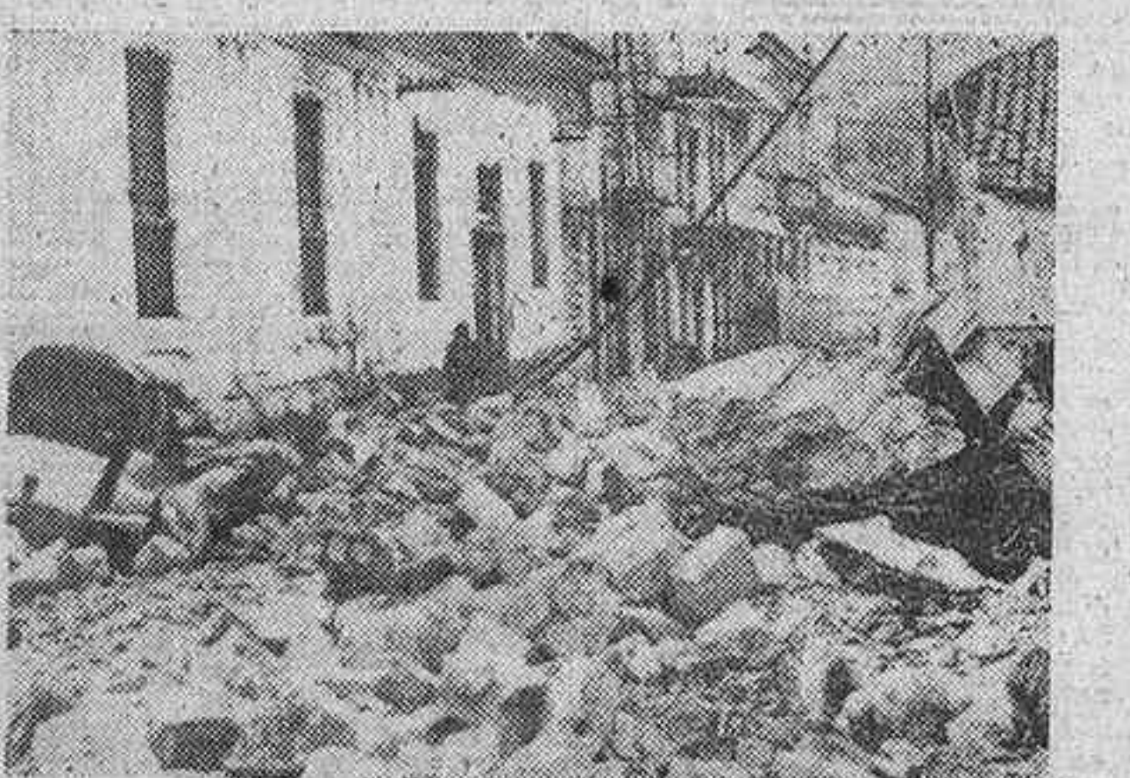
AMBATO.—Vista parcial de la calle más importante de esta ciudad la tercera del Ecuador, totalmente destruida a consecuencia del terremoto, cuyas víctimas rebasan ya la cifra de 6.000 muertos.