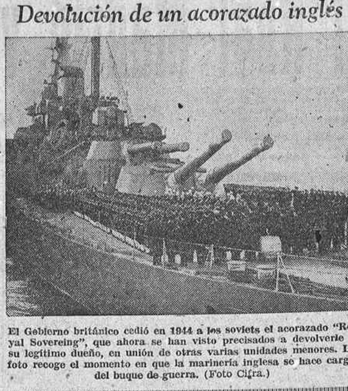
El Gobierno británico cedió en 1944 a los soviets el acorazado "Royal Sovereign", que ahora se han visto precisados a devolverlo a su legítimo dueño...