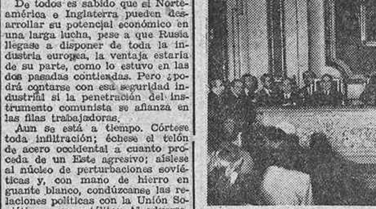
Mesa presidencial del acto que en la mañana de ayer se celebró en el Circolo de la Unión Mercantil para clausurar la conmemoración del I aniversario de la fundación del Montepío Comercial e Industrial de Madrid.