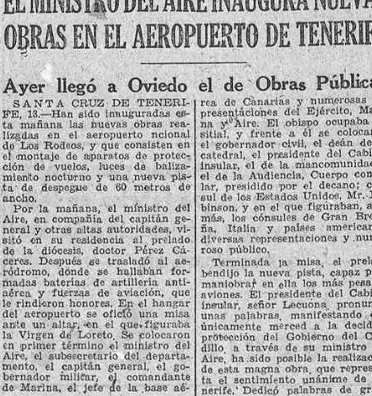
Después pronunció un discurso el ministro del Aire, en el que puso de manifiesto la satisfacción que sentía por hallarse de nuevo en Tenerife...