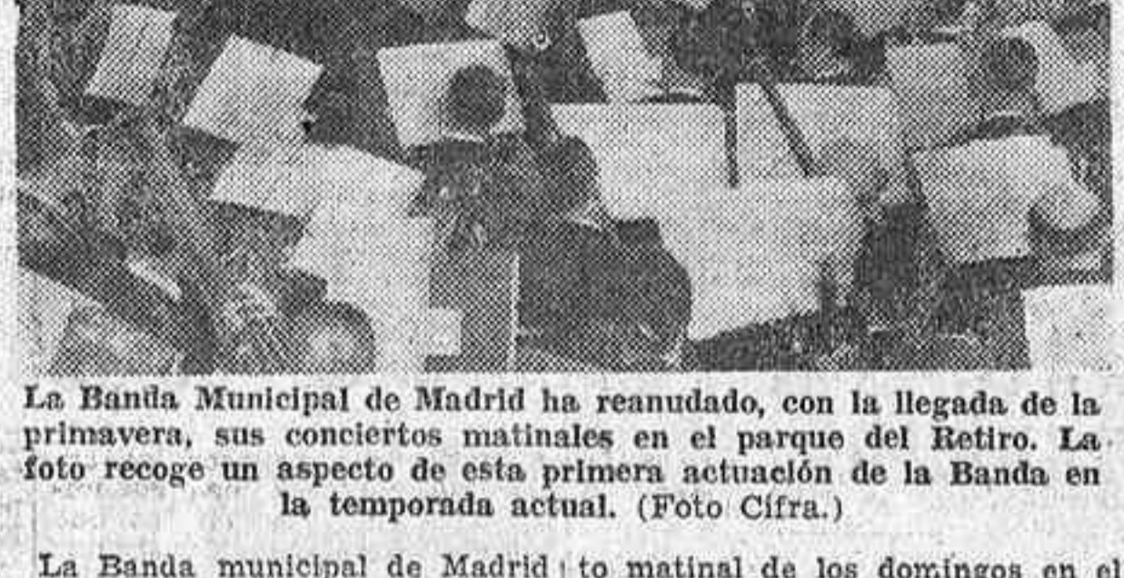
La Banda Municipal de Madrid ha reanudado, con la llegada de la primavera, sus conciertos matinales en el parque del Retiro. La foto recoge un aspecto de esta primera actuación de la Banda en la temporada actual.