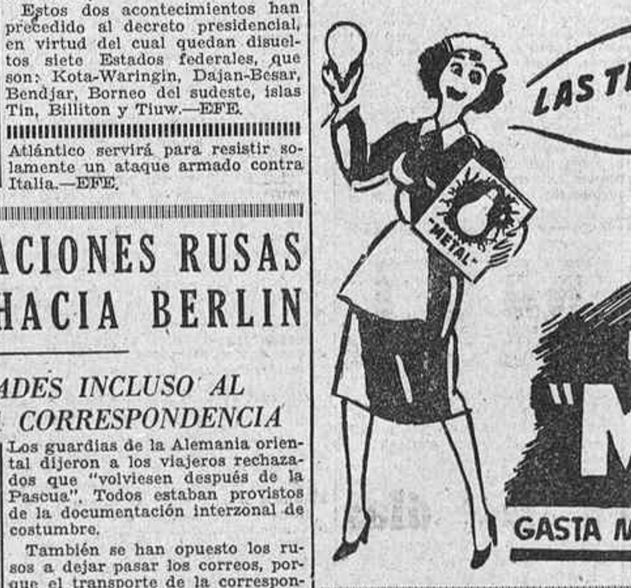
LAMPARA "METAL" GASTA MENOS RINDE MAS

El día 3: Reuniones de trabajo de los patronatos y secciones; a las doce y media, visita al Museo del Prado.