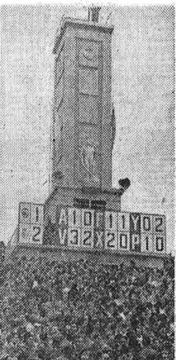
El partido de ayer en Chamartín ofreció a los aficionados al fútbol la novedad del tablero simultáneo, con el cual pudo seguir el público el desarrollo de todos los partidos de la Primera División jugados en provincias. En el gran tablero se va dando cuenta de los tantos marcados en cada encuentro a los pocos instantes, así como del resultado final.

El presente número de la HOJA DE LUNES se vende a 55 céntimos. La cantidad que excede del precio habitual será destinada por disposición superior, al sostenimiento de la Institución de San Isidro para huérfanos de periodistas.