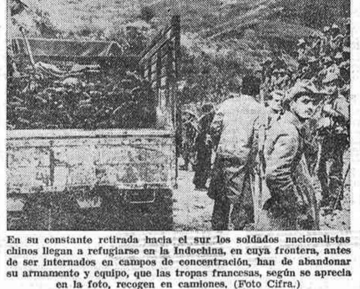
En su constante retirada hacia el sur los soldados nacionalistas chinos llegan a refugiarse en la Indochina, en cuya frontera, antes de ser internados en campos de concentración, han de abandonar su armamento y equipo, que las tropas francesas, según se aprecia en la foto, recogen en camiones.

La aviación nacionalista causa grandes daños a los comunistas con sus bombardeos