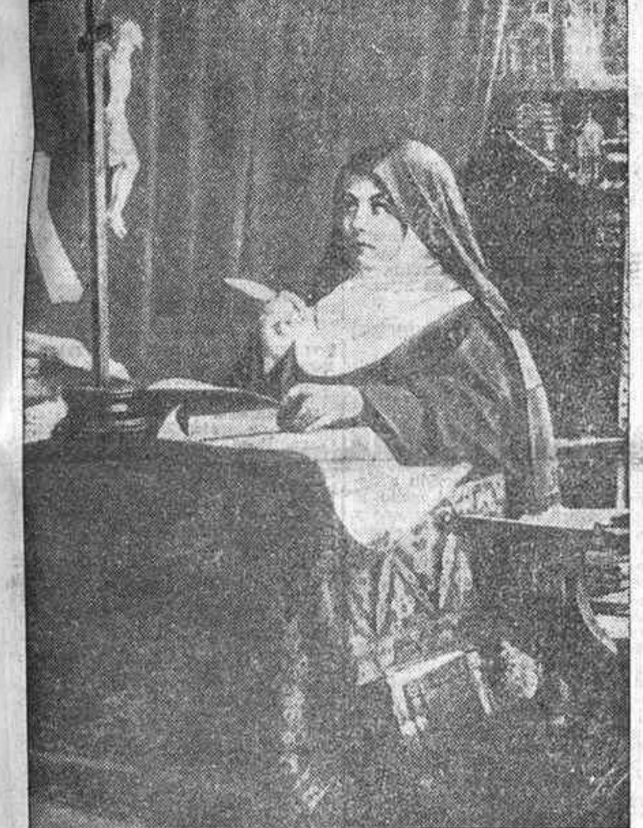
La venerable María Soledad Torres Acosta, fundadora de las Hermanitas Siervas de María, ministras de los enfermos, que ayer fué beatificada en solemne ceremonia celebrada en la Ciudad del Vaticano.