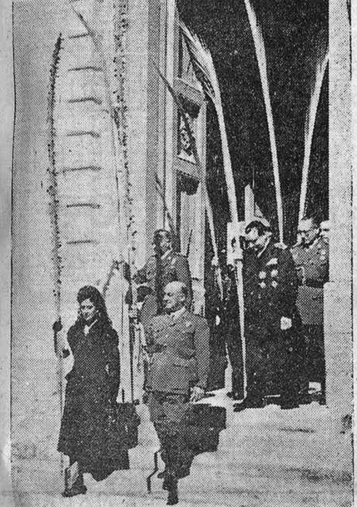
Con motivo de la festividad del Domingo de Ramos, se celebró ayer en El Pardo la procesión de las palmas, a la que asistieron Su Excelencia el Jefe del Estado y su esposa, a quienes acompañaron los miembros de las Casas Militar y Civil del Generalísimo. La foto ha recogido el momento de la salida de palacio para concurrir al acto religioso.

Con el mayor entusiasmo salen en toda España las primeras procesiones