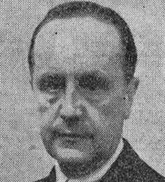
Don Raimundo Fernández Cuesta.

"Intemperie, victoria y servicio" (1) es la enunciación de una trayectoria de España y de la Falange a través de la personalidad que ha abarcado las tres etapas de la vida nacional. Raimundo Fernández Cuesta, el nombre del primer secretario de la Falange y el del actual secretario general del Movimiento que ha acertado a situar a la Falange en la primera línea de servicio del Estado español. Entre una y otra ocasión del mismo nombre han transcurrido dieciséis años, una línea temporal que, se mire a donde se mire, ha producido en el mundo entero radicales cambios y mudanzas superiores a cuanto pueda sugerir una imaginación desahogada. Pongámonos en 1935, fecha del primer discurso que esta recopilación de las oraciones y escritos de Raimundo Fernández Cuesta ha recogido. Son unas líneas del "Arriba de la mocedad, que seguramente se abreviarán en otra prensa más madura, pero auténticas para expresar a la voz del secretario ha resumido el programa de Falange en dos puntos: "devolver a España una ambición histórica e implantar en ella una mejor justicia social". No es posible encontrar dentro de la línea actual del pensamiento político un tema contemporáneo que no haya periclitado peligrosamente, que no haya sido enterado en el olvido o en el lodaz. En cambio, el nuestro sigue vigente y adelante por el camino de la realización.