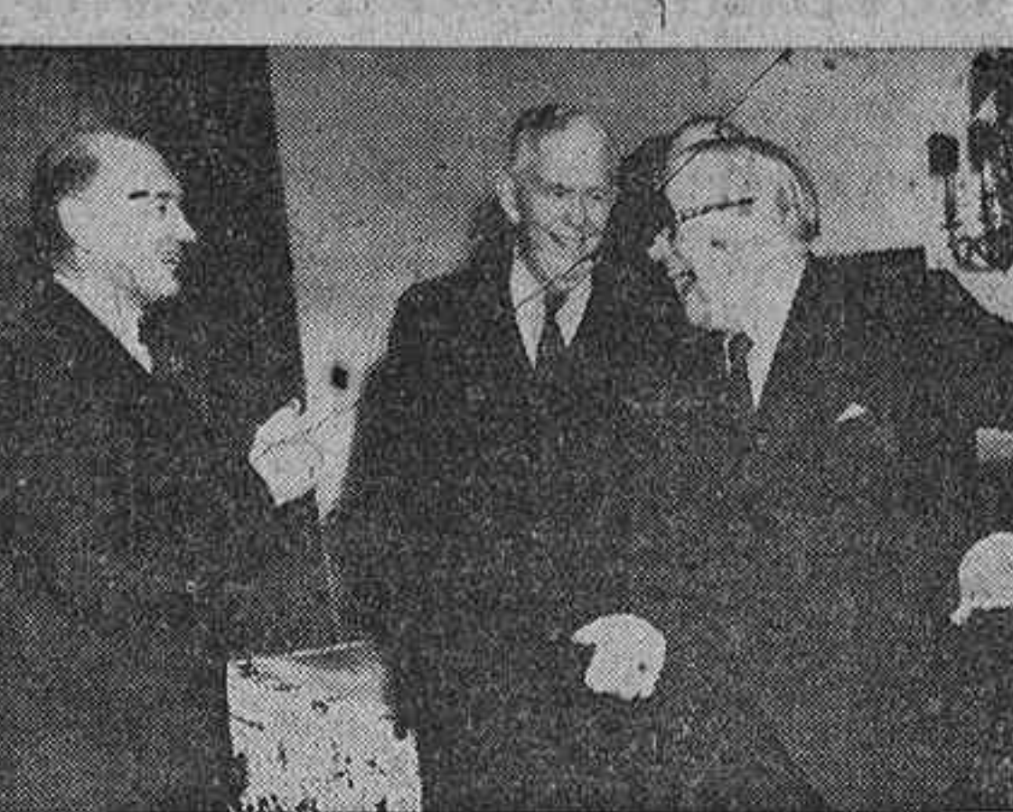
He aquí un momento—uno de los escasos momentos—de cierta amable alegría en la Conferencia que los Ministros de Asuntos Exteriores de los "Cuatro Grandes" están celebrando en Londres...