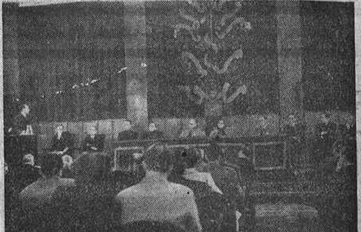
Presidencia del acto de clausura de las Jornadas Sociales de Acción Católica, celebrado en la mañana de ayer en el domicilio del Consejo Superior de Investigaciones Científicas.

PRESIDIERON EL ACTO LOS OBISPOS DE ERESO Y DE SIGÜENZA