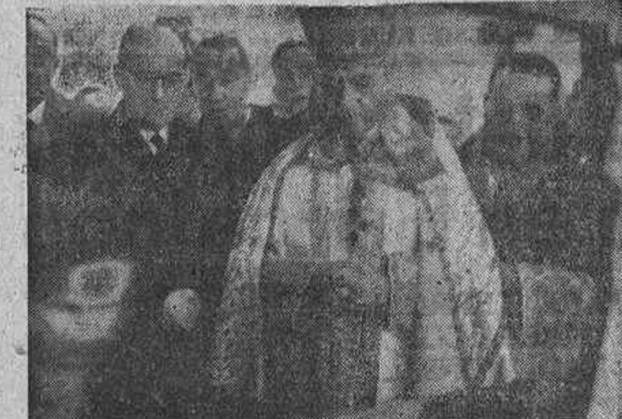
El Obispo de Madrid-Alcalá y Patriarca de las Indias Occidentales, don Leopoldo Eljo Garay, procede, en presencia del Ministro de Educación Nacional, señor Ibáñez Martín, a la bendición de las escuelas y edificios anexos de la iglesia parroquial madrileña de Santa María de la Cabeza.

ASISTIO A LA CEREMONIA EL MINISTRO DE EDUCACION NACIONAL