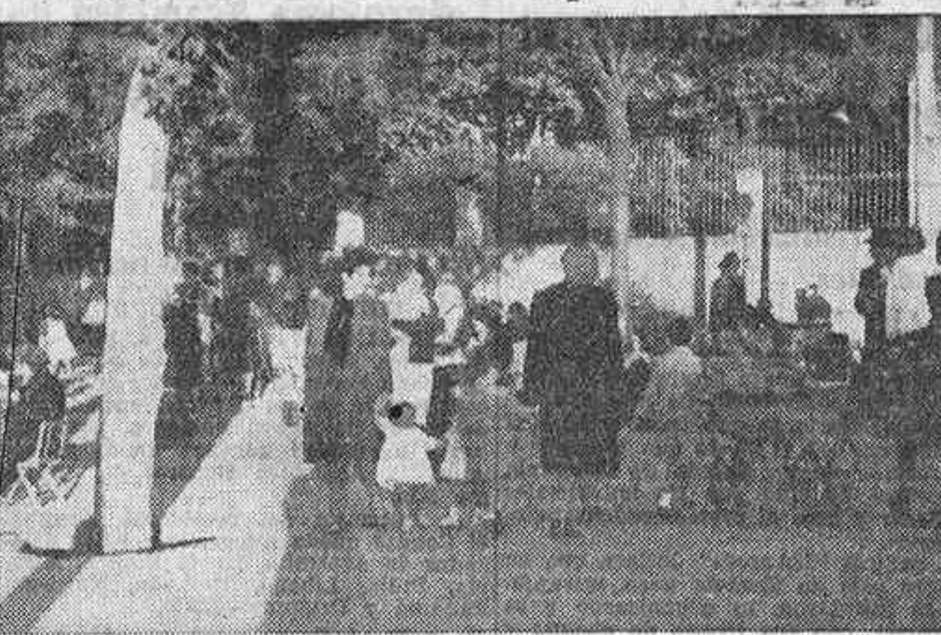
El Observatorio Meteorológico comienza a dar la impresión optimista de que parece acercarse un régimen de lluvias. Pero en el día de ayer continuó todavía este retrasado "veranillo", seco y pegadizo...