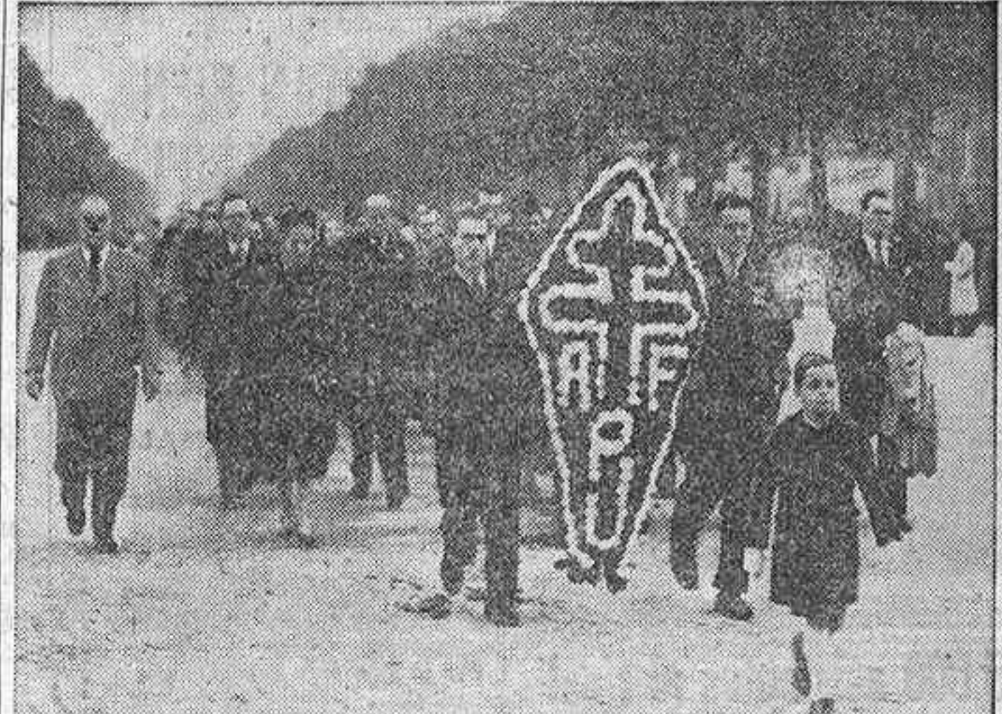
Una representación del partido Rassemblement du Peuple Français, seguidor del general De Gaulle y que tan brillante victoria ha logrado en las pasadas elecciones municipales, desfila por las calles de París para depositar una corona de flores en la tumba del Soldado Desconocido, con motivo del aniversario del armisticio que el 11 de noviembre de 1918 puso fin a la primera guerra mundial.

SE EXTIENDE LA HUELGA EN MARSELLA, QUE TIENE EL ASPECTO DE CIUDAD SITIADA