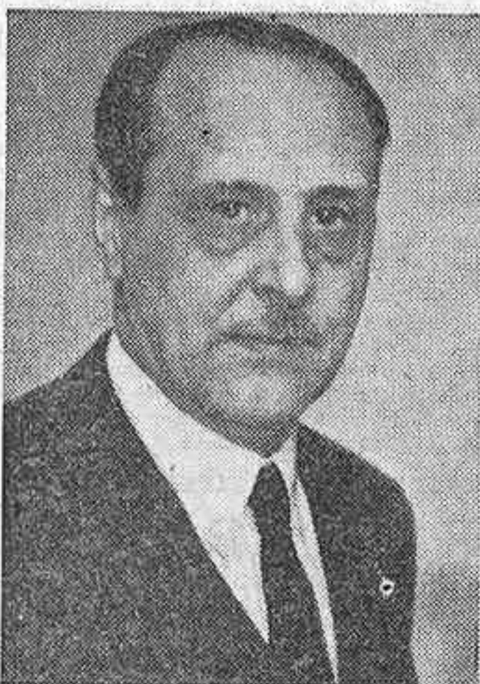
Don Esteban Bilbao, Presidente de las Cortes Españolas. (Foto Cifra).

Tomaron parte en el acto, que presidió el ministro de Trabajo, el alcalde y el presidente de la Diputación