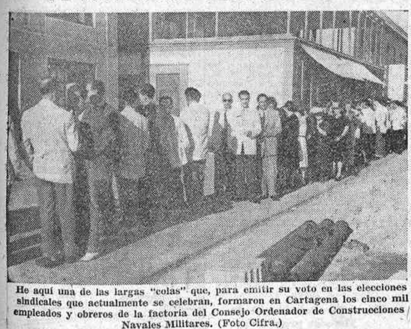
He aquí una de las largas "colas" que, para emitir su voto en las elecciones sindicales que actualmente se celebran, formaron en Cartagena los cinco mil empleados y obreros de la factoría del Consejo Organizador de Construcciones Navales Militares.