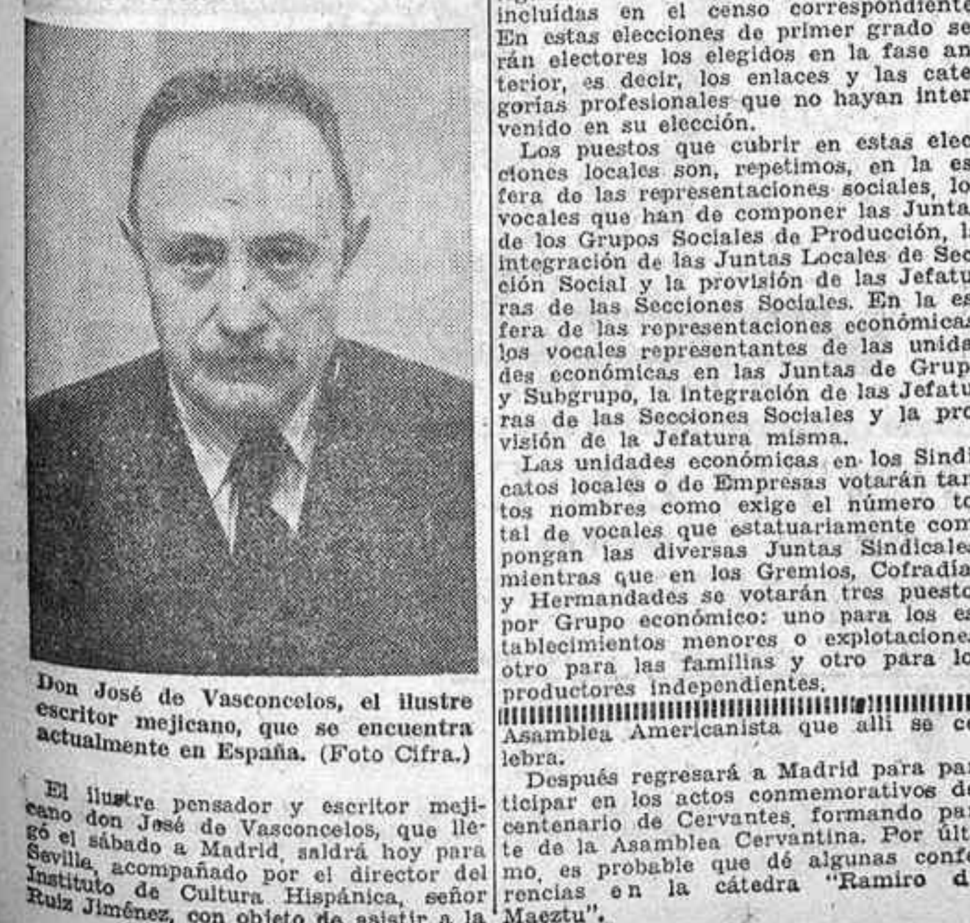
Don José de Vasconcelos, el ilustre escritor mejicano, que se encuentra actualmente en España.

Asistirá a las sesiones de la Asamblea Americanista