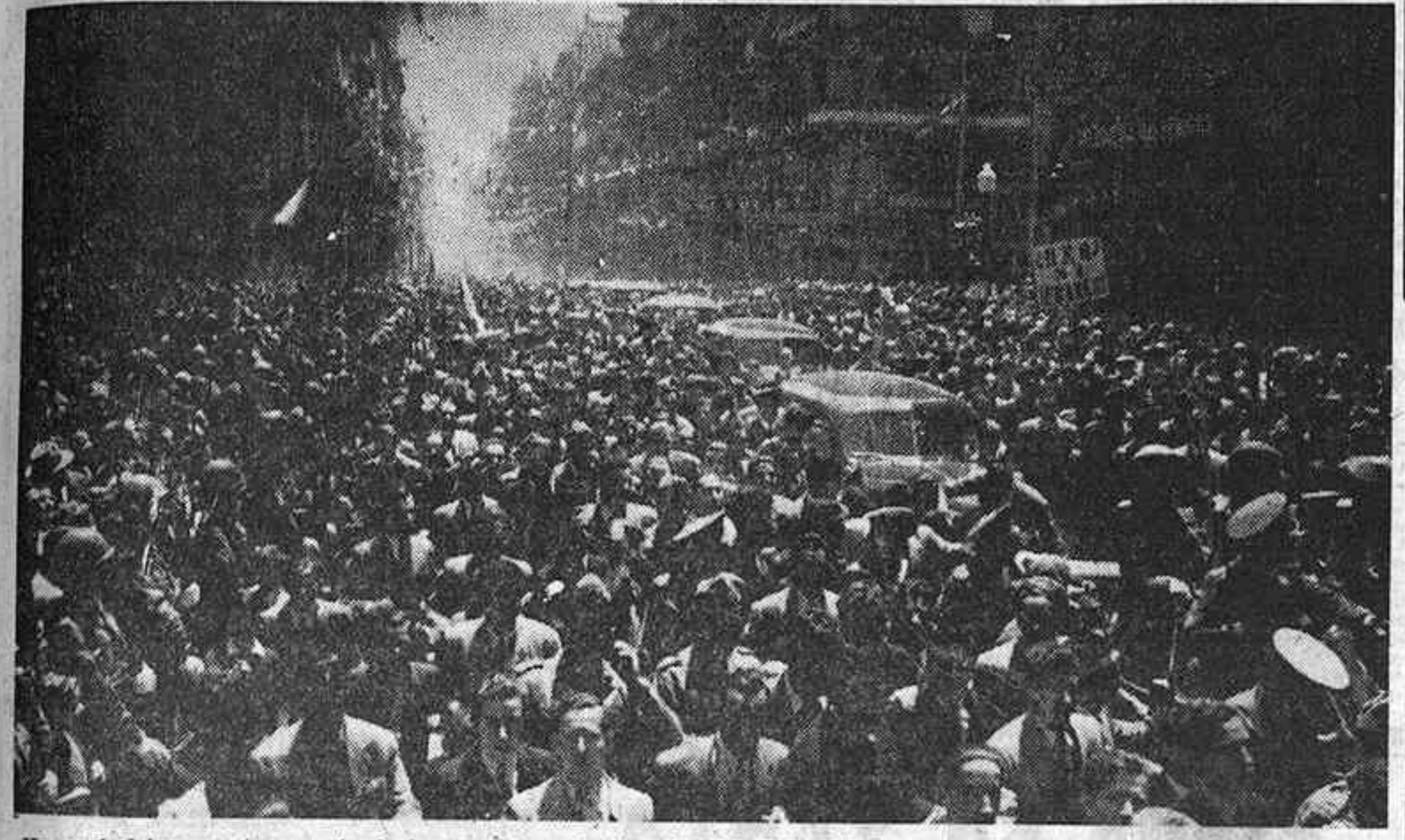
He aquí el imponente aspecto de las ramblas a la llegada del Jefe del Estado a Barcelona, procedente de Palma de Mallorca. Una inmensa muchedumbre rodea los coches del séquito y aclama sin cesar a España y al Caudillo a través de todo el itinerario comprendido entre el puerto y la catedral.

Fué aclamado por 25.000 espectadores en la plaza de toros. Anoche asistió a un banquete de gala ofrecido por la Diputación. "Mientras no se desarmen las conciencias, seguirá cerniéndose la amenaza de guerra sobre las naciones"