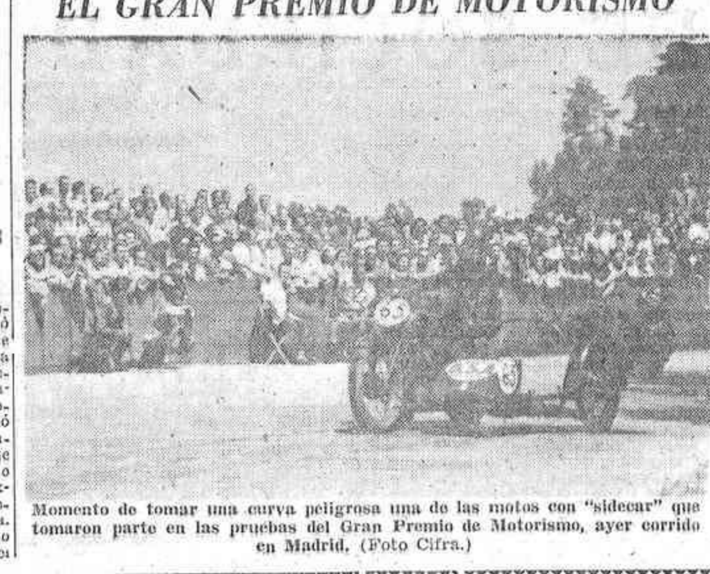
Momento de tomar una curva peligrosa una de las motos con "sidecar" que tomaron parte en las pruebas del Gran Premio de Motorismo, ayer corrido en Madrid.