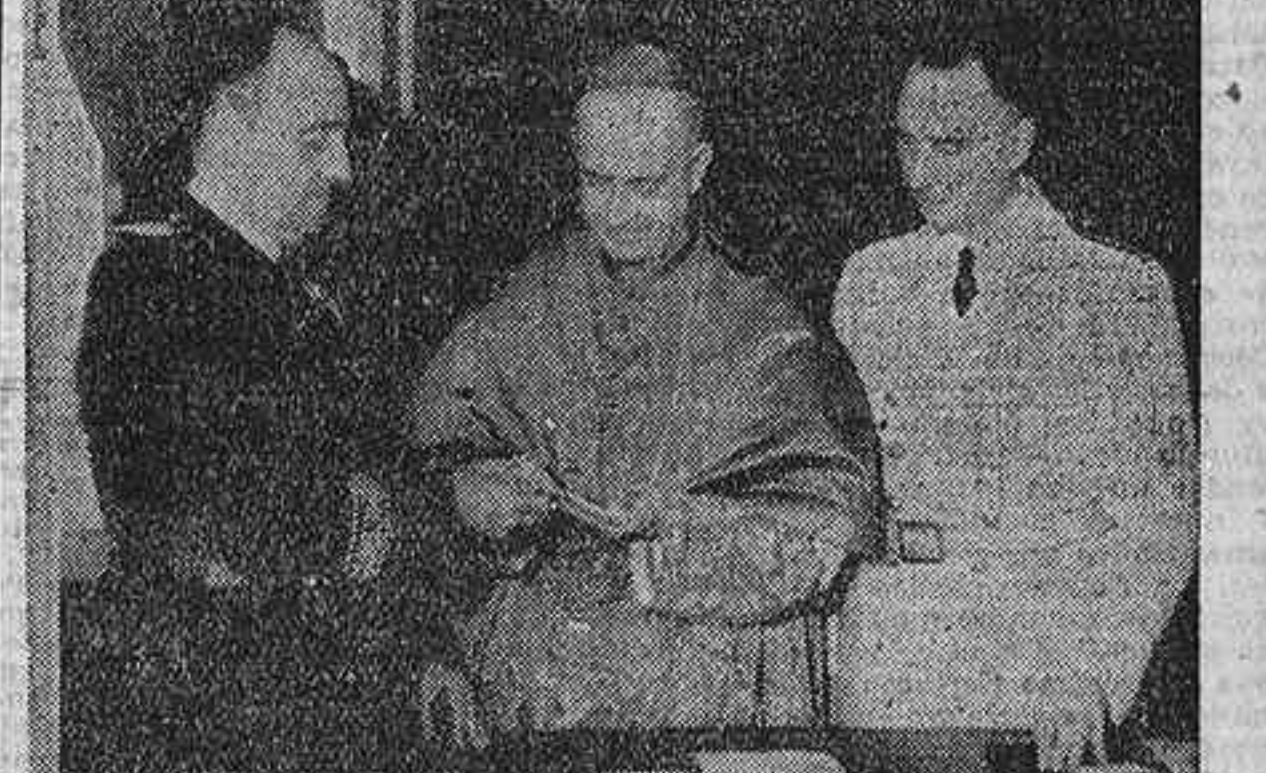
El marqués de la Valdivia hace entrega al doctor Eijo Garay del blasón de Madrid, que le ha sido concedido por la Diputación Provincial con motivo de sus bodas de plata con la diócesis.

El jueves, el Ayuntamiento le entregará la medalla de oro de la ciudad