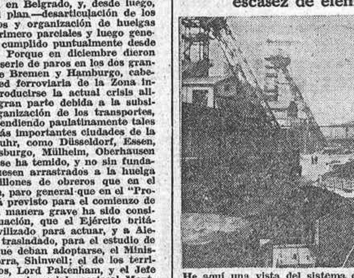
He aquí una vista del sistema de transporte de las minas de carbón del Ruhr, de ocupación británica...