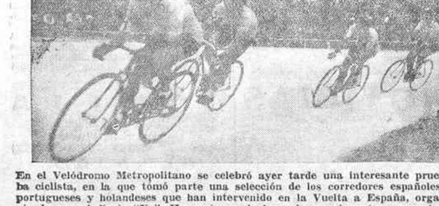
En el Velódromo Metropolitano se celebró ayer tarde una interesante prueba ciclista, en la que tomó parte una selección de los corredores españoles, portugueses y holandeses que han intervenido en la Vuelta a España, organizada por el diario "Ya".