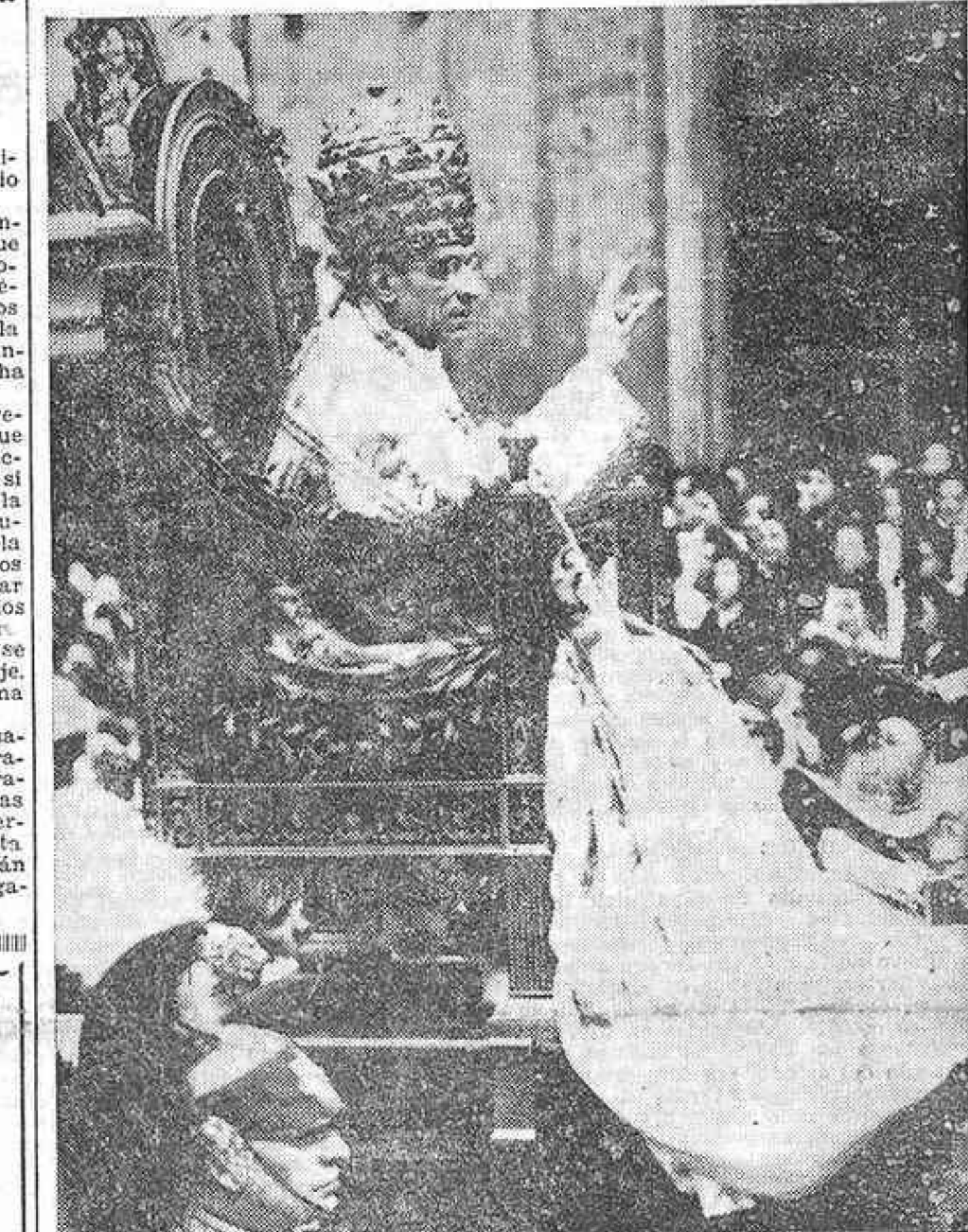
SU SANTIDAD EL PAPA PIO XII

"Pocos remedios son tan urgentes, dijo el Papa en su alocución, como la difusión del catecismo" "El mundo sufre males dolorosísimos, pero pocos son tan trascendentales como la ignorancia religiosa"