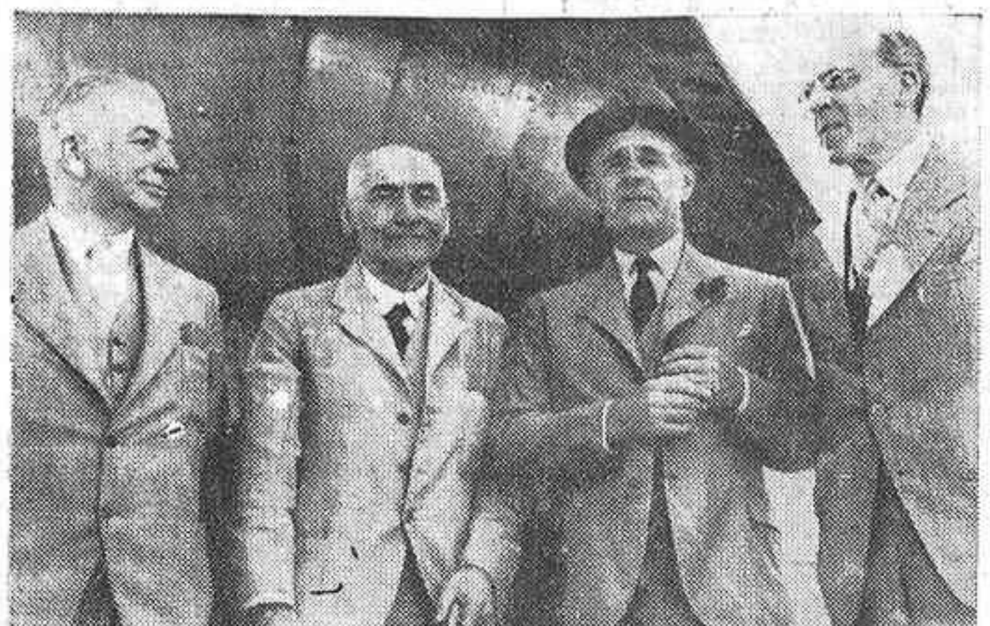
La delegación británica enviada para estudiar y proponer soluciones al problema político de la India ha llegado a Nueva Delhi, donde fue recibida por el virrey, lord Wavell. De izquierda a derecha: el primer lord del Almirantazgo, Alexander; el secretario de Estado para la India, lord Pethick-Lawrence; el virrey, lord Wavell, y el ministro de Industria, sir Stafford Cripps.