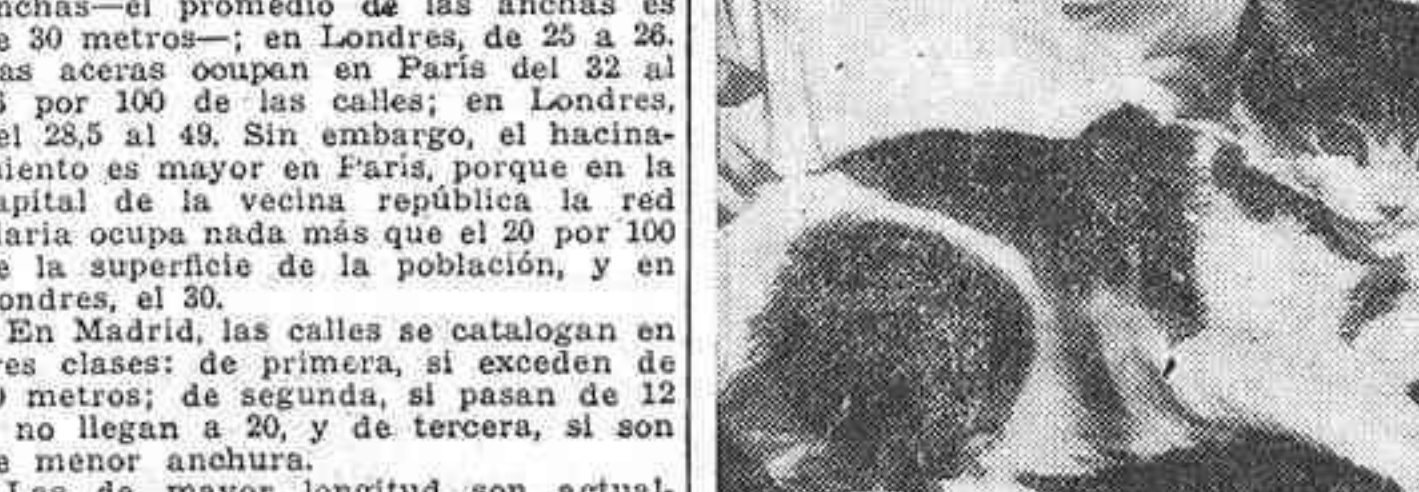
Como en una inverosímil fábula, este gato neoyorquino de la fotografía ha hecho amistad con siete ratoncillos. Y la amistad debe de ser estrecha, a juzgar por la cara de complacencia casi protectora con que el gato asiste a los juegos de los pequeños roedores.