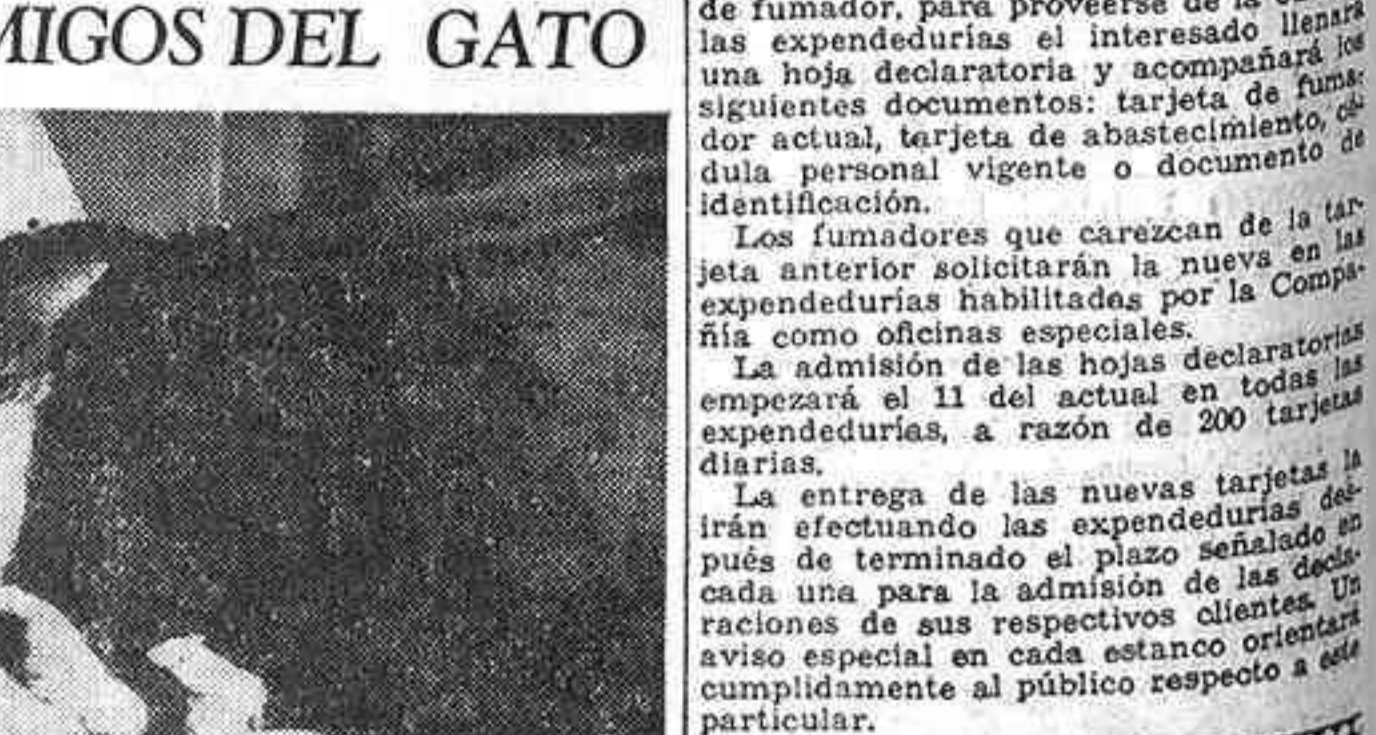
Como en una inverosímil fábula, este gato neoyorquino de la fotografía ha hecho amistad con siete ratoncillos. Y la amistad debe de ser estrecha, a juzgar por la cara de complacencia casi protectora con que el gato asiste a los juegos de los pequeños roedores.