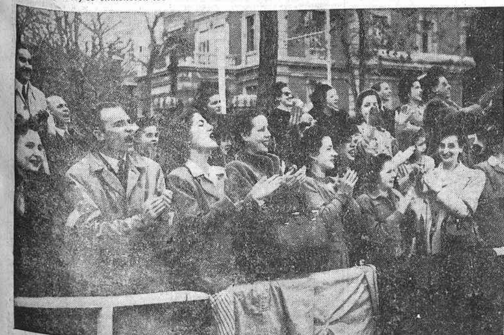
He aquí reflejado de manera inequívoca en los rostros el fervor con que el pueblo de Madrid acogió la presencia de Franco cuando, entre ovaciones y vivas de auténtico carácter, atravesó las calles de la capital en la mañana de la conmemoración de la Victoria.