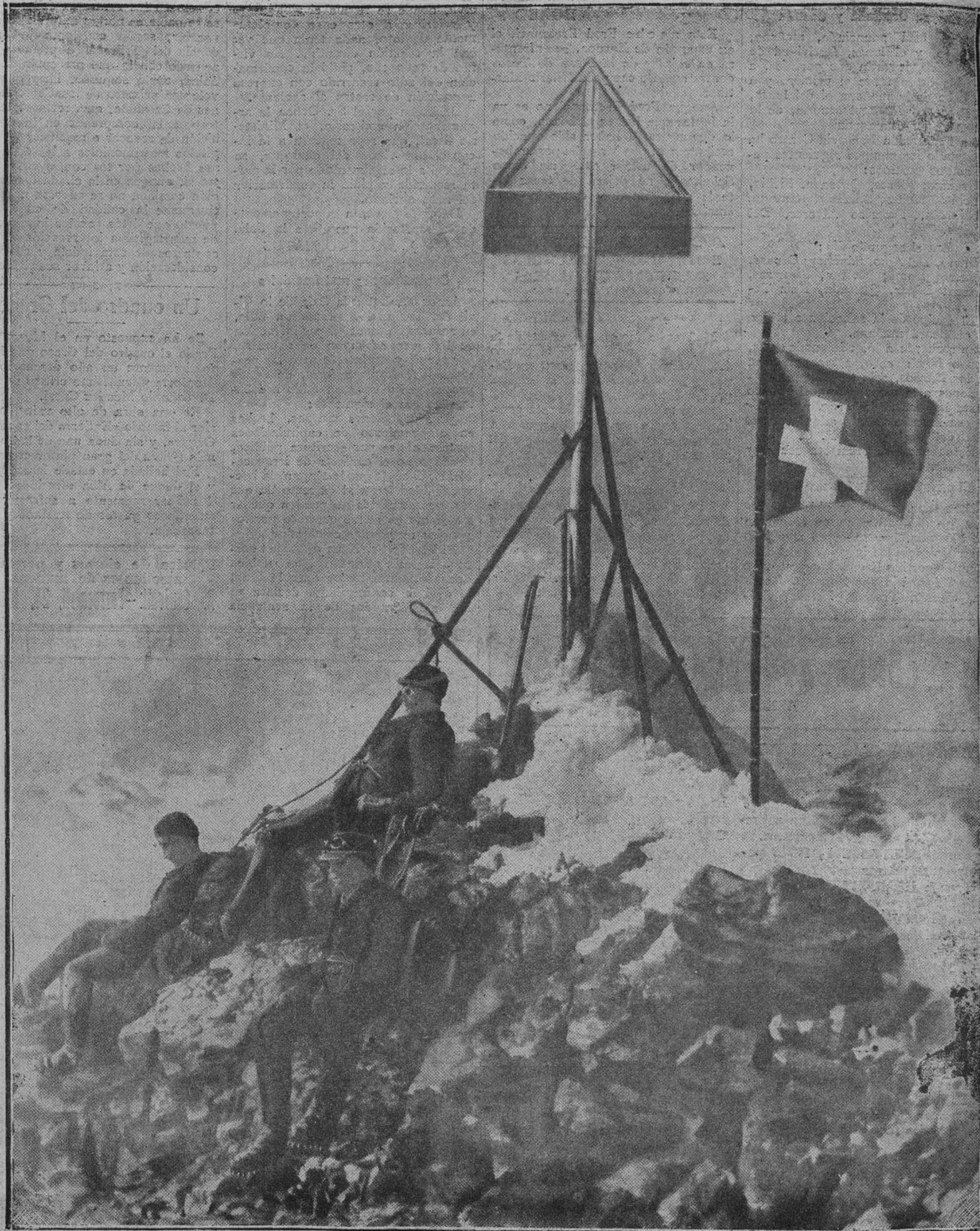
Estas maravillosas series de fotografías fueron tomadas durante la expedición organizada por el Instituto de Investigación Internacional para la "Scientific Cinematograph", de Zurich, para la ascensión invernal del "Piz Bernina" (más de 13.000 pies), el pico más alto de la Suiza del Este. La expedición, que ha tenido por objeto tomar escenas para el film "The Relation of the Man to the Mountain", ha sido la primera que ha tomado la cámara cinematográfica en una altitud semejante, y su tarea les ha ocupado cinco meses.