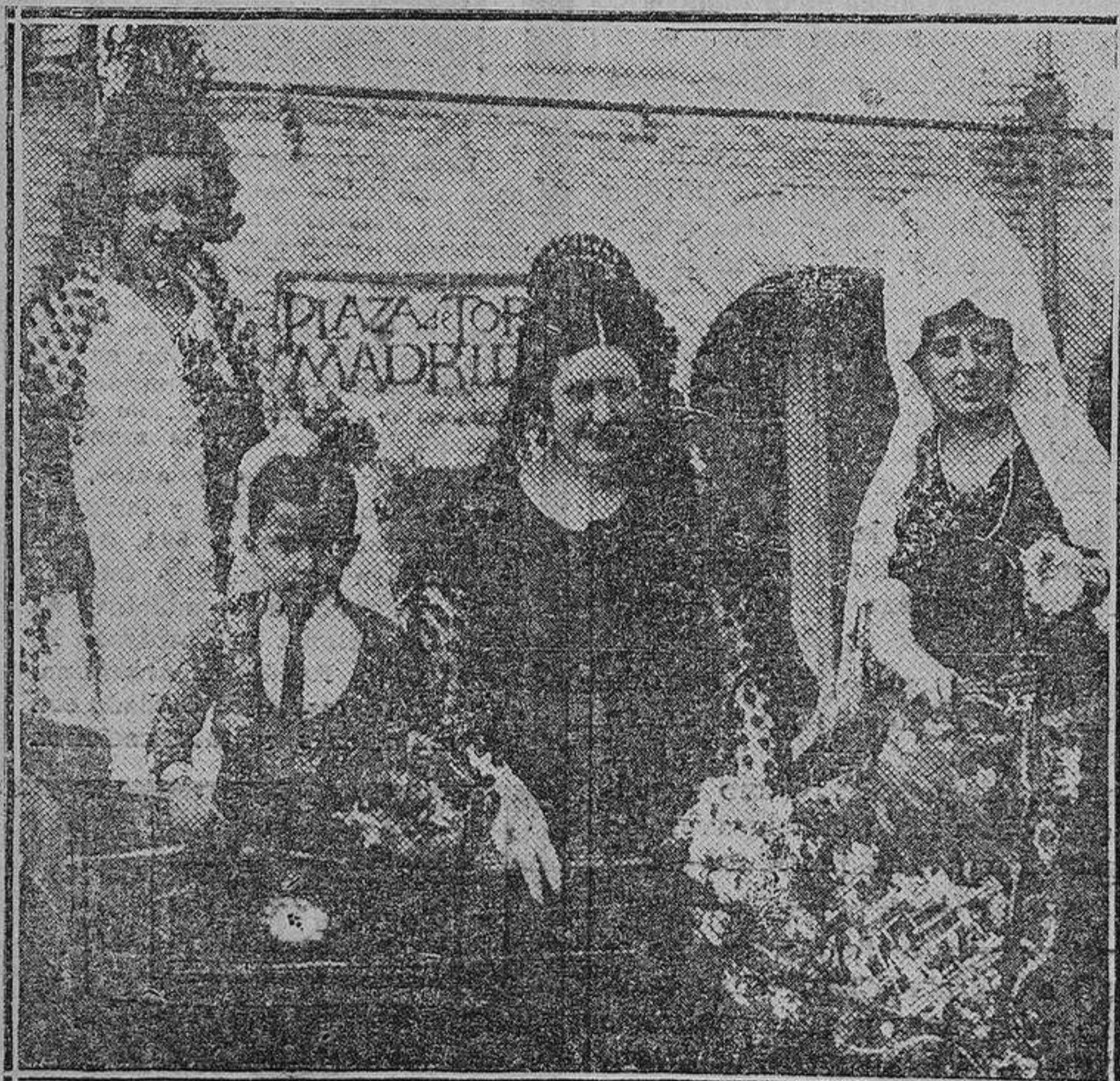
Las presidentas de la becerrada de las telefonistas, que se celebró ayer.

ASCENSORES, MONTACARGAS, ETC. Munar y Guitart, S. en C. Diego de León, 6. - Teléfono 52-8. - MADRID. SERVICIO ESPECIAL PARA LA CONSERVACION PRESUPUESTOS GRATIS