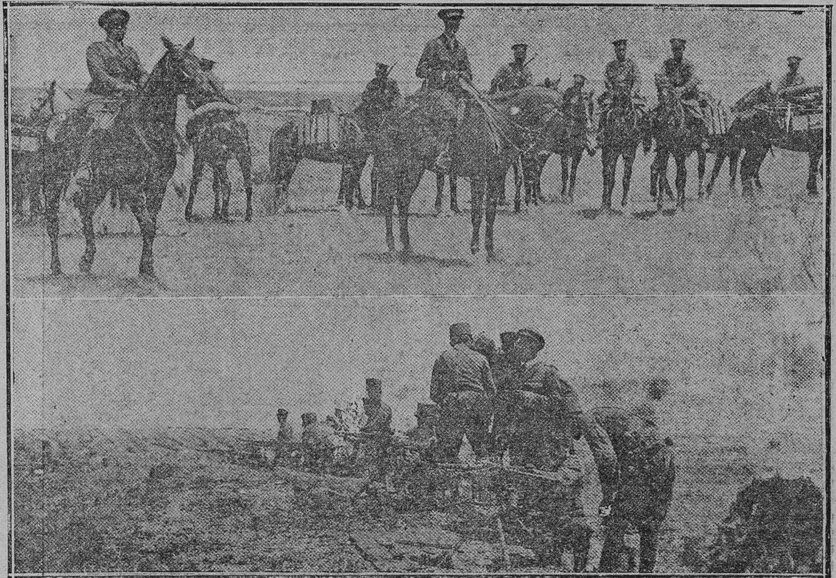
El grupo de ametralladoras del cupo de instrucción durante las prácticas que realizaron ayer en el campamento de Carabanchel, y a las que asistió el Príncipe de Asturias.

E. A. J., 7.—Unión Radio.—430 metros.—A las dos y treinta, Miscelánea de sobremesa.