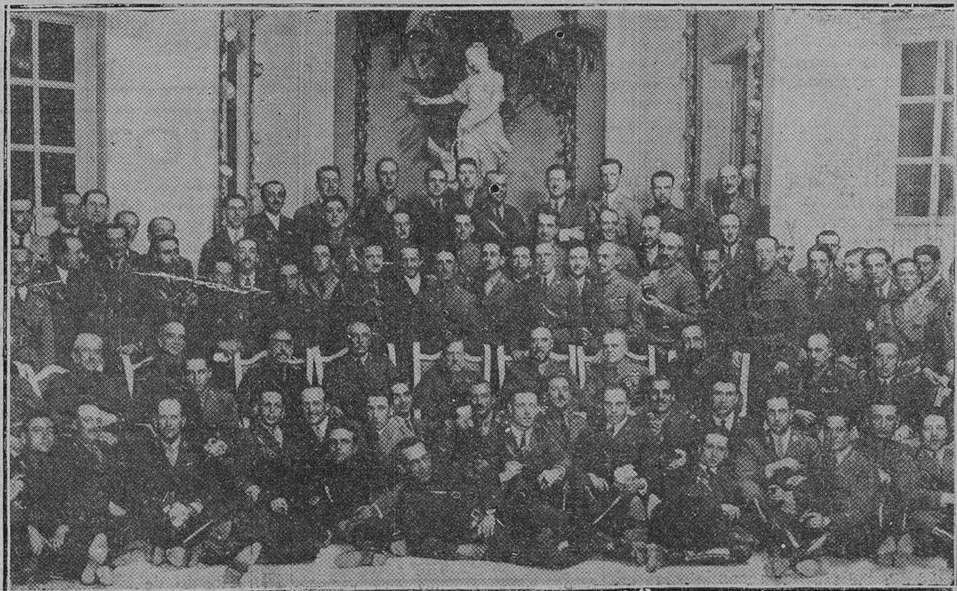
Concurrentes al banquete que los oficiales de complemento dieron ayer en honor de sus profesores.