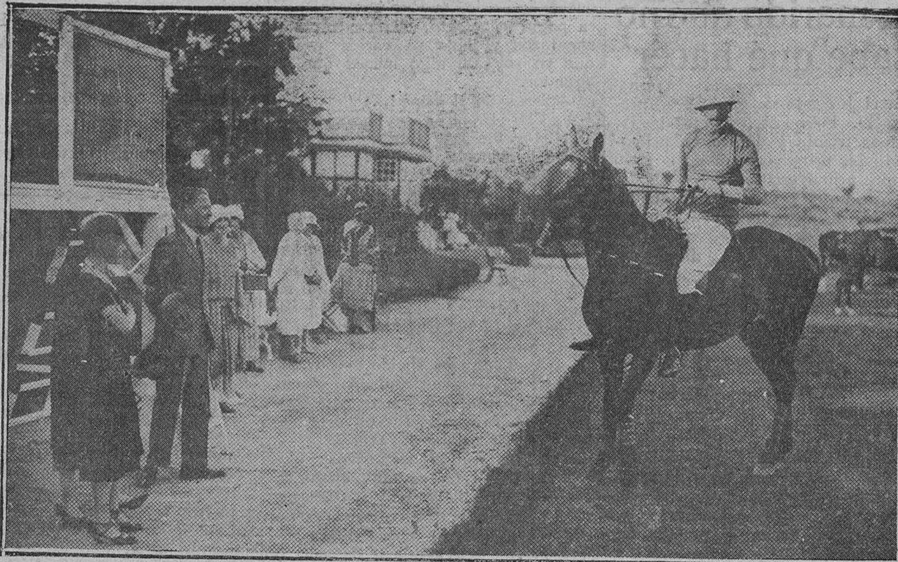
S. M. el Rey conversando con su augusto hijo, el Príncipe de Asturias, durante un descanso en el partido de polo en que se disputó la Copa de la Reina.