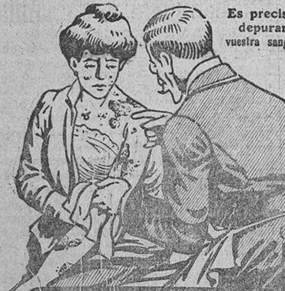
Es preciso depurar vuestra sangre

VAYAN A VICHY (Francia) ES EL PRIMER Establecimiento termal Los HOTELES SON LOS MAS COMODOS EL CASINO ES EL MAS LUSO DEL MUNDO ENTERO HOTEL-RADIO Hotel y Restaurant de Regimen con vigilancia medica ELGORRIAGA BAÑOS SALINOS Y HOTEL Temporada: junio, julio, agosto y septiembre. Linfatismo, anomalías, crecimiento, esterilidad, escrófula, flujos. Informes. Admor. Baleario, NAVARRA. Imp. de LA CORRESPONDENCIA DE ESPAÑA Factor, 7.