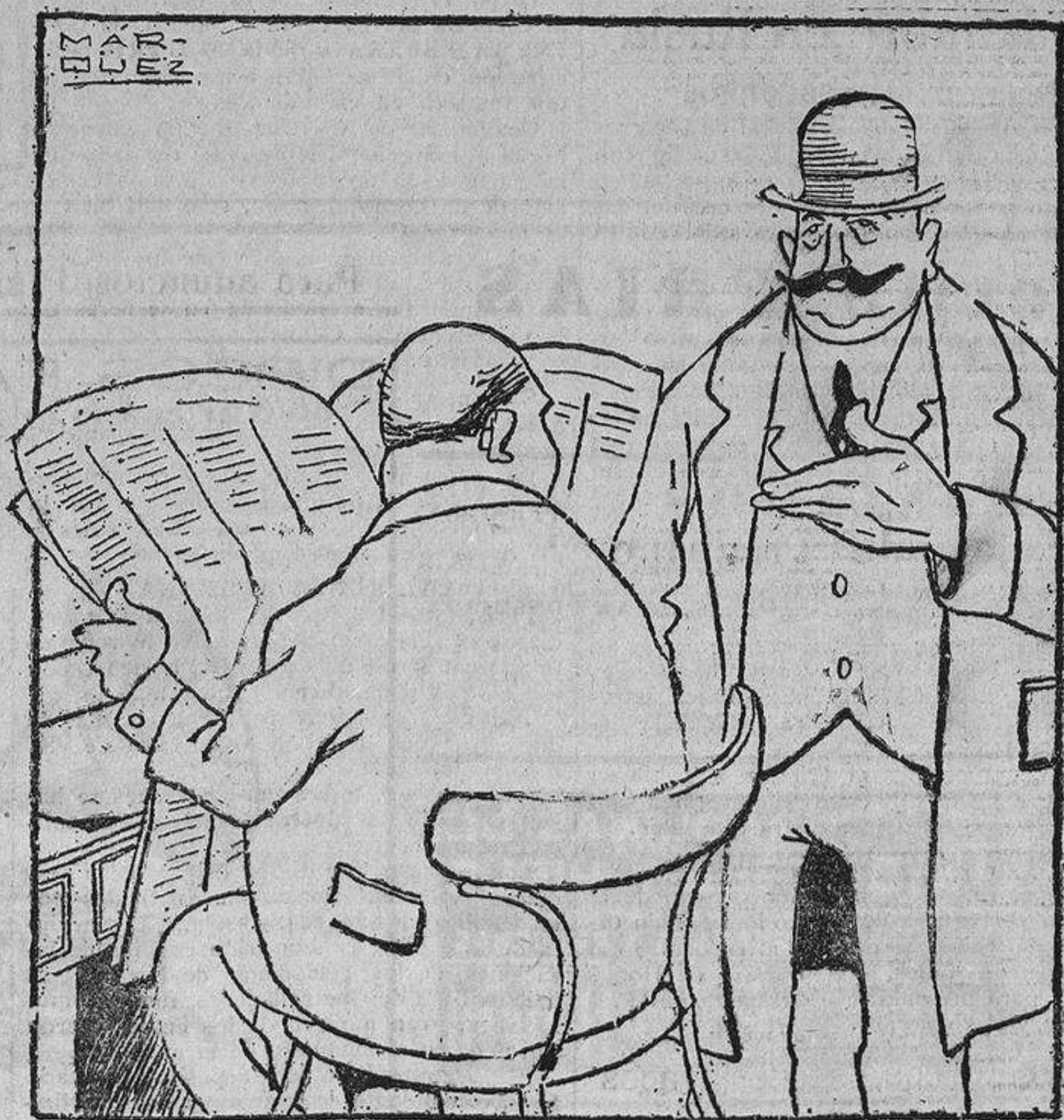
—Este diario se extraña de que no haya unanimidad en juzgar el acto de Unamuno. —En lo de Unamuno no hay unanimidad por ser una-nimiedad.