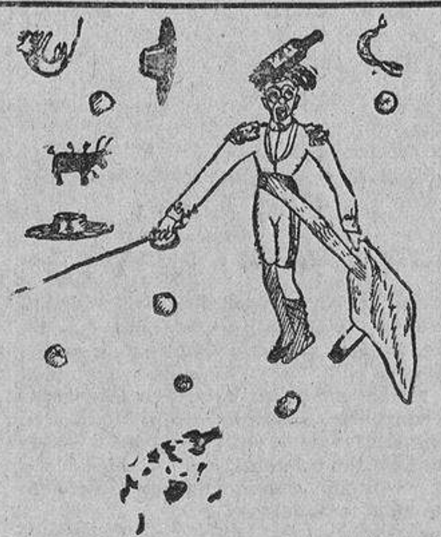
Dibujo hecho por Francisco Pardo Esteban. Catorce años. Madrid.