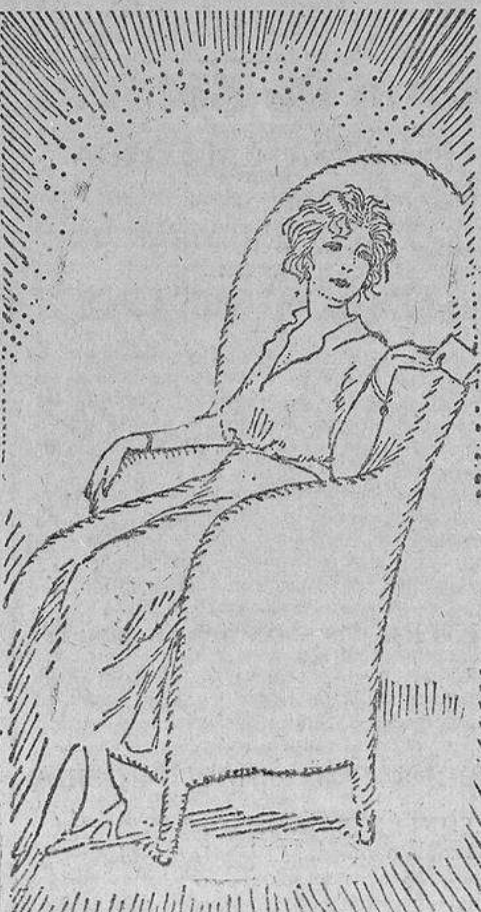
En el jardín de una quinta vió a Bessie...

Daring y Anderlecht, 3 a 0. R. C. Bruxelles y Standard, 2 a 0. C. S. Verviers y F. C. Bruges, 1 a 1. La Gantoise y F. C. Malines, 1 a 0.