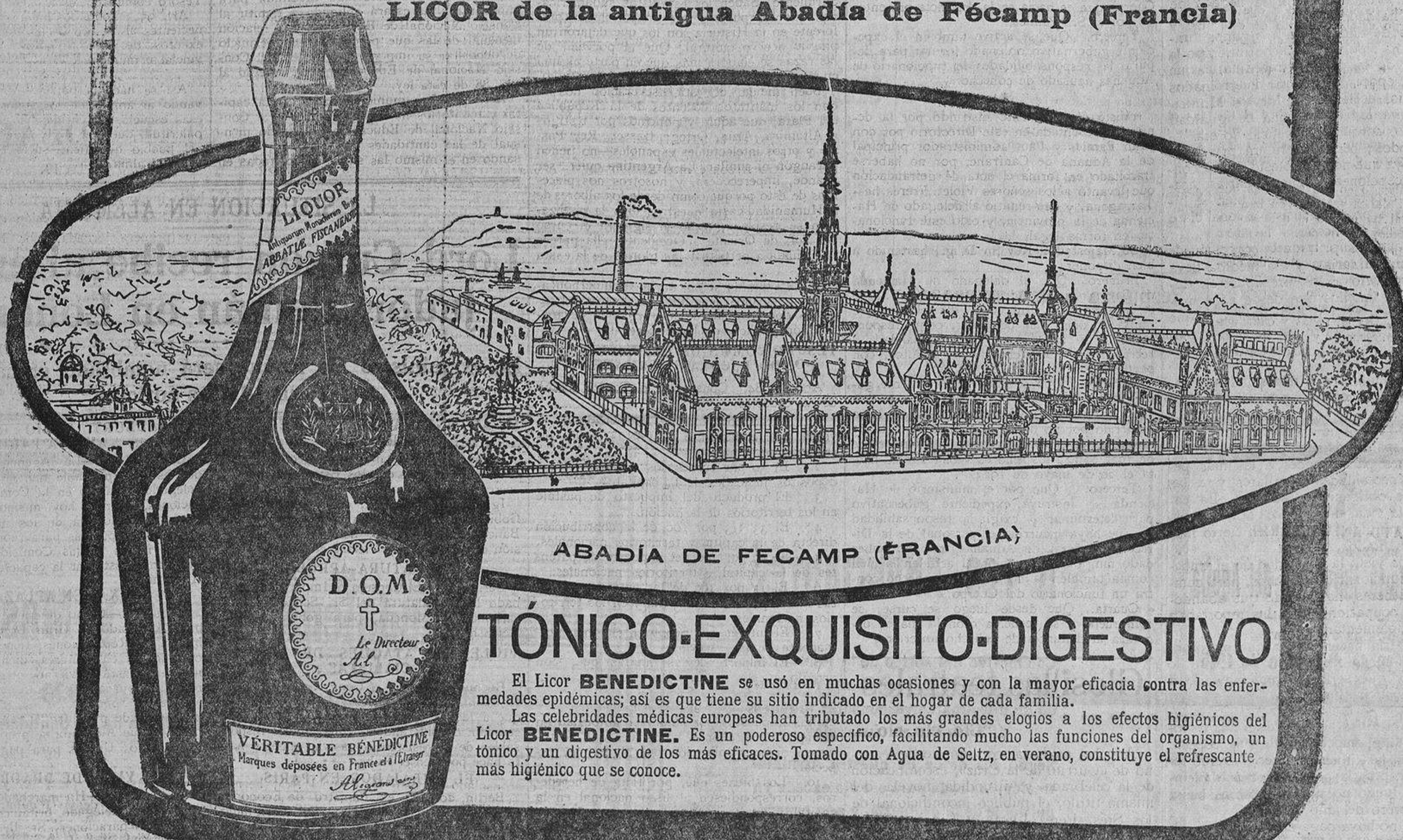
ABADÍA DE FECAMP (FRANCIA)

LICOR de la antigua Abadía de Fécamp (Francia)