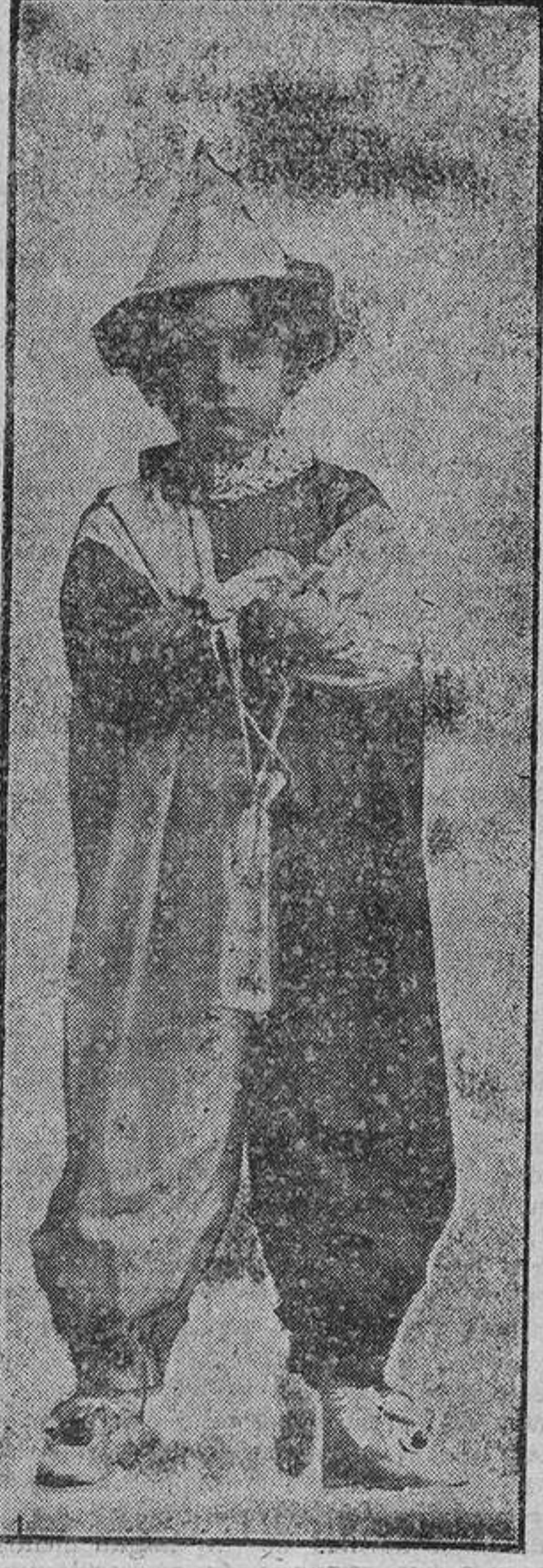
Niña a quien la suerte favoreció, y hoy tiene ya en su poder el precioso juguete La procesión de mi pueblo.

Este simpático lectorcito nos remitió la siguiente carta: «Sr. Director de LA CORRESPONDENCIA DE ESPAÑA.