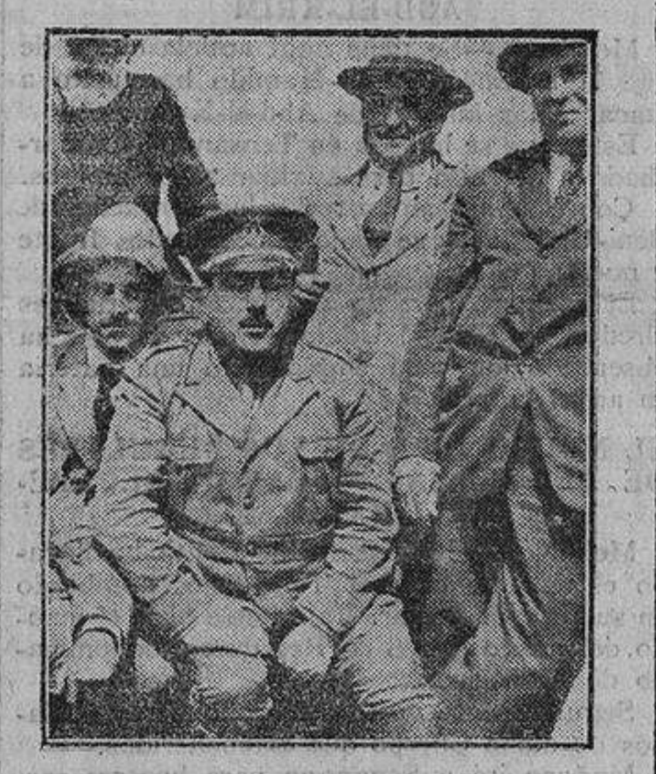
Curiosa fotografía del actual ministro de Guerra, Sr. Rodríguez de Viguera, comandante del Cuerpo Jurídico, en la visita que hizo a la zona de Melilla a raíz del desastre de Annual.

Ginebra, 5.—El Gobierno británico ha comunicado al Secretariado de la Sociedad de Naciones el texto de un decreto por el que queda abolida la esclavitud en la parte del antiguo Oeste africano alemán, que actualmente ha sido denominada territorio de Tanganyika y colocada bajo el mandato de la Gran Bretaña. Dicho decreto lleva por título «Decreto ordenando la abolición de la servidumbre no deseada». Prevé la supresión inmediata de toda forma de esclavitud en el territorio de Tanganyika y dispone que, a partir de la fecha de la publicación del decreto, los Tribunales no reconocerán los derechos emanados de la propiedad sobre una persona o sobre su trabajo. Garantiza además así a los antiguos esclavos, como a sus sucesores jurídicos, la propiedad sobre todos los bienes que éstos hayan adquirido por medio de su trabajo, por herencia o por donativo. Cada infracción que se cometa de este decreto será castigada con una multa que no bajará de cincuenta libras esterlinas, dos años de prisión o ambas penas a la vez.