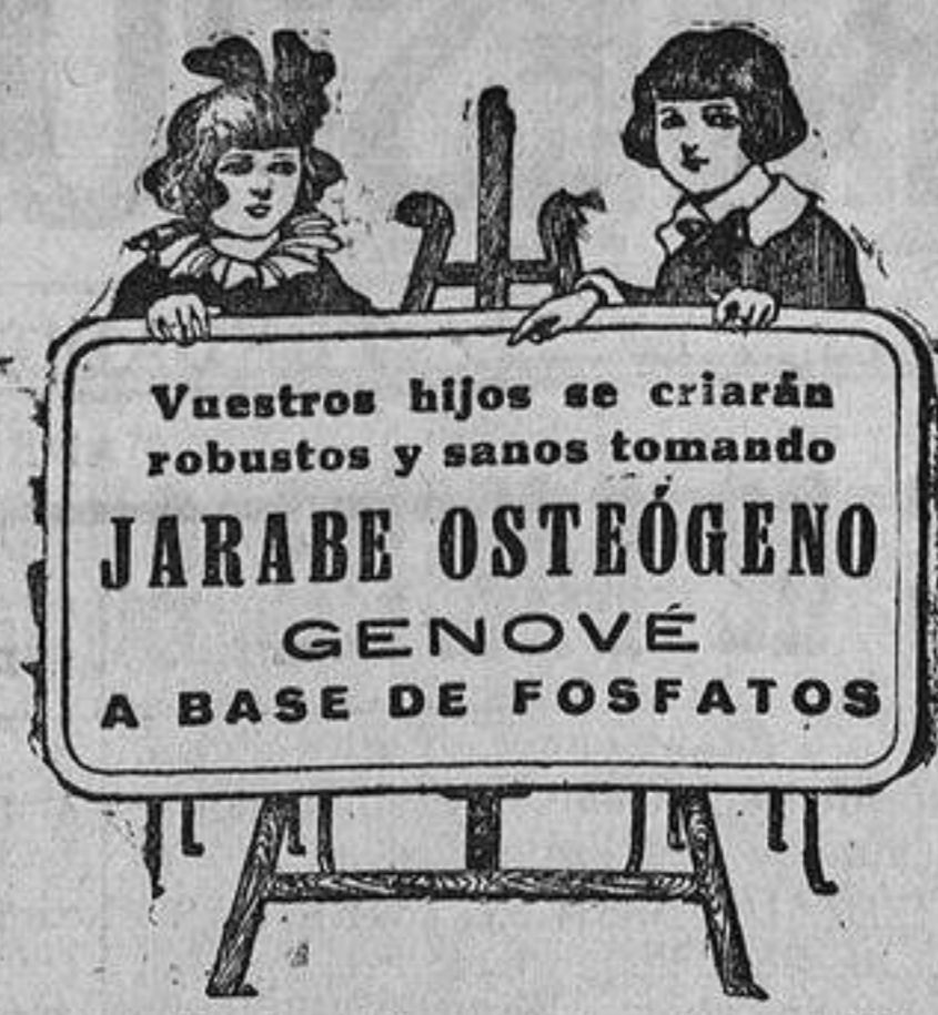
En todas las farmacias y centros de específicos

AVISO La casa que paga más por toda clase de alhajas, dentaduras, PAPELETAS DEL MONTE es Plaza Santa Cruz, 7, Platea. — Teléfono 772 M