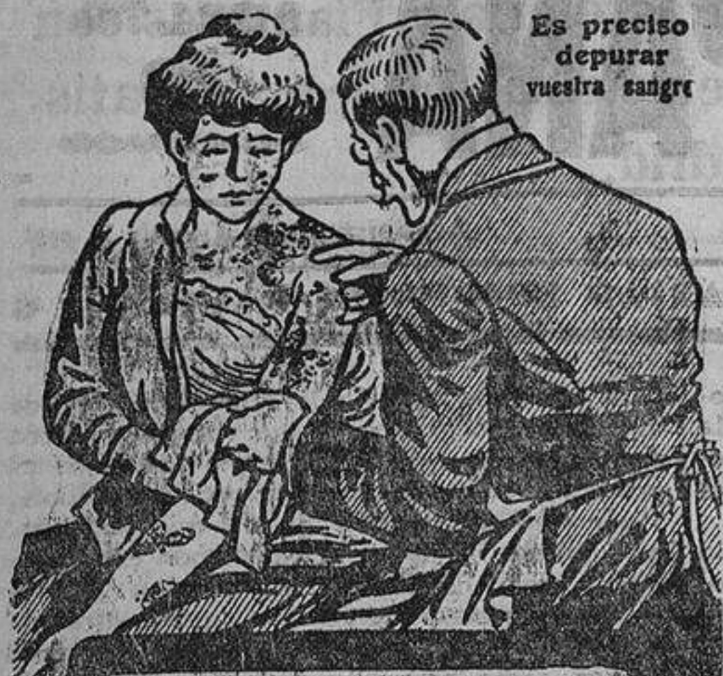
Es preciso depurar vuestra sangre