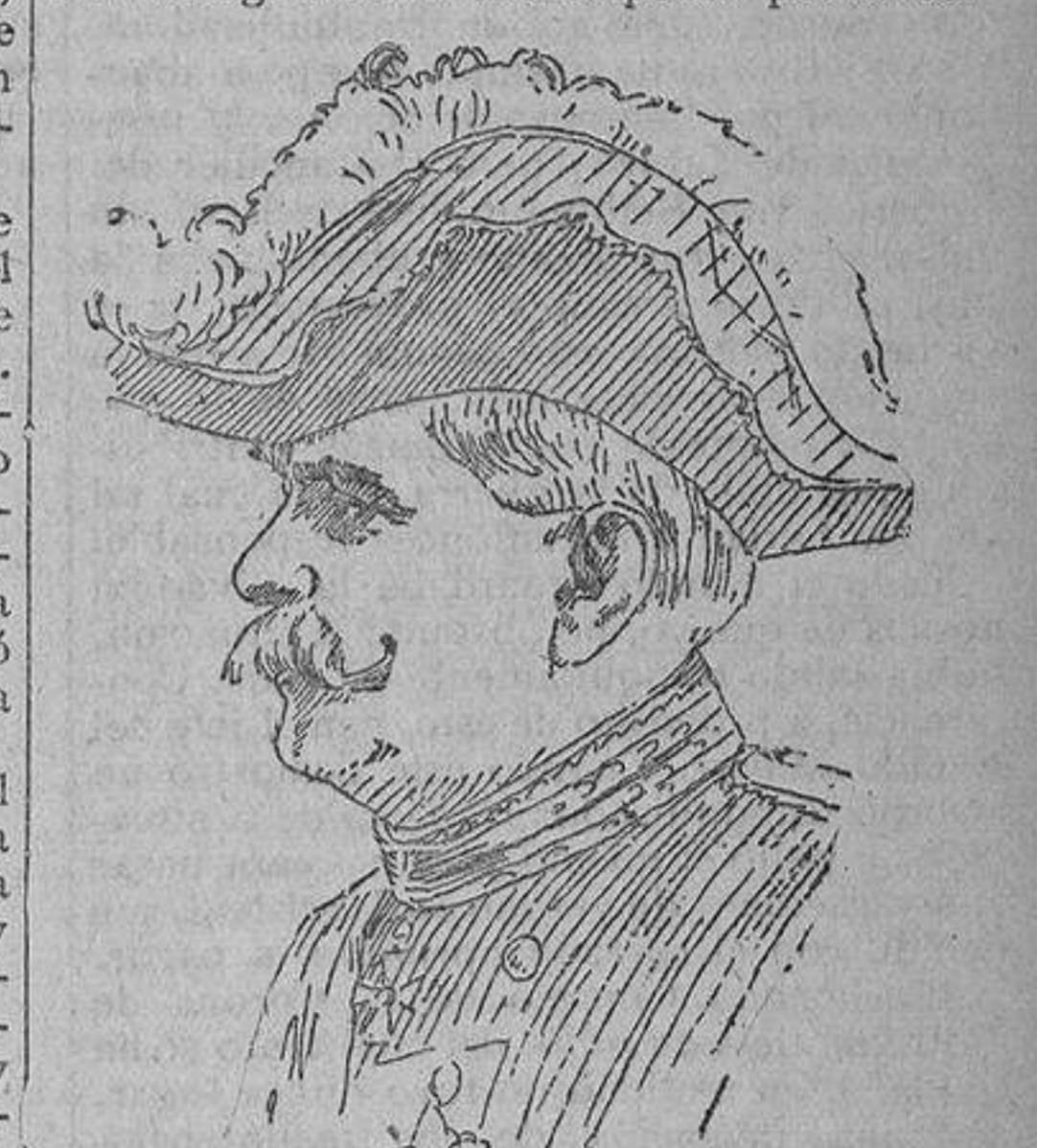
Tirpitz, mariscal de los ejércitos franceses

Con gran dolor de mi corazón dejé partir a este hombre tan activo como enérgico, que había llevado a cabo mis planes, siendo para mí un colaborador infatigable. De mi agradecimiento imperial puede es-