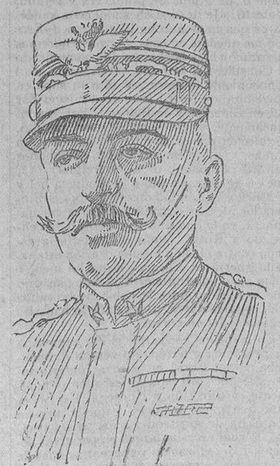
Cadorna, general in jefe de los ejércitos italianos

Séptima. Un ruso de elevado rango, miembro de la Duma, muy relacionado con Sazonow, me contaba más tarde datos del consejo secreto de la Corona celebrado bajo la presidencia del Zar en 1914, datos que me fueron confirmados por otras fuentes rusas que estaban anotadas en mis tablas históricas. En este Consejo de la Corona hizo Sazonow un informe, en el que propuso al Zar tomara Constantinopla. Como quiera que la Triple no accedería a