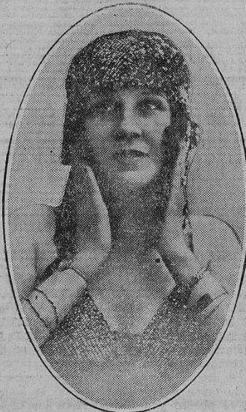
bella y notable bailarina, que debutará en breve en un teatro de Madrid.