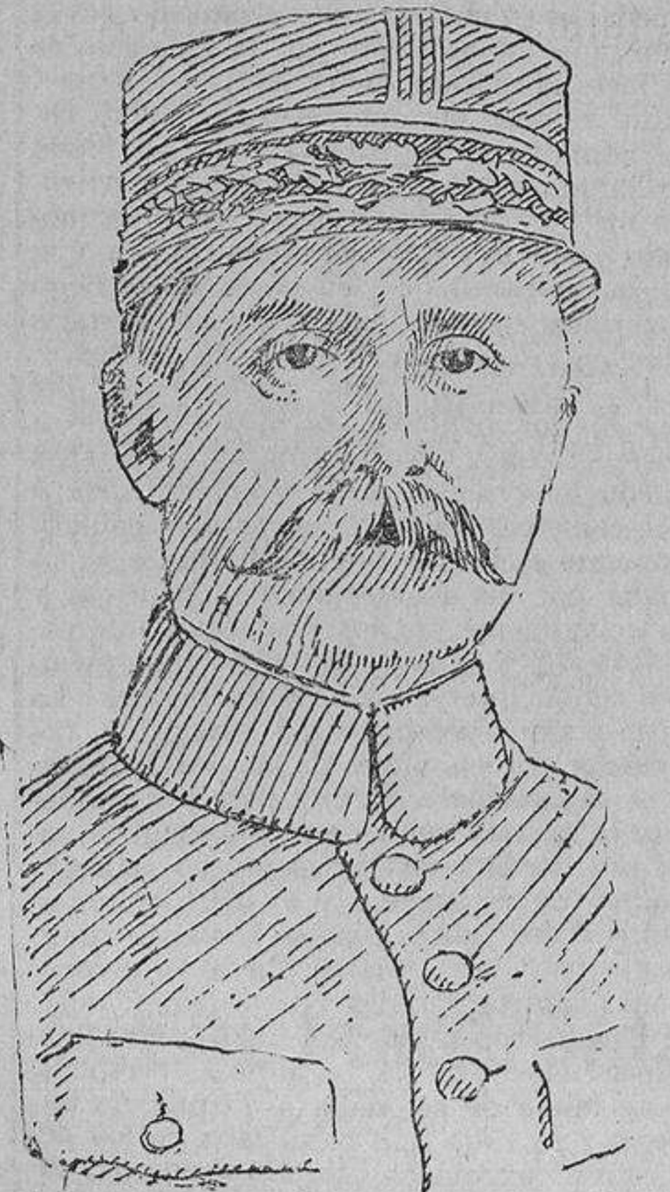
Petaín, general de los ejércitos franceses

Canciller y al ministerio de Negocios Extranjeros (Estado) en conflicto con el jefe del Estado Mayor, porque el general von Moltke era de parecer que la guerra estallaría irremisiblemente, mientras que los dos primeros seguían firmes en su opinión de que no se llegaría a esto; que la guerra se podría evitar, con tal de que yo no diese la orden de movilización. Esta disputa duró largo tiempo. Únicamente cuando el general Von Moltke dió parte de que los rusos habían establecido un cordón de tropas en la frontera, levantado los rails del