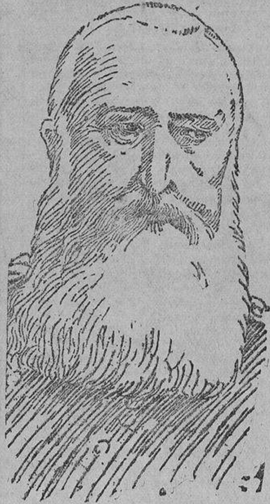
Leopoldo II, Rey de Bélgica.

a ataques violentos hasta de los Círculos religiosos, porque el público no estaba bastante preparado para aquello. El esclarecimiento de este asunto me dió también