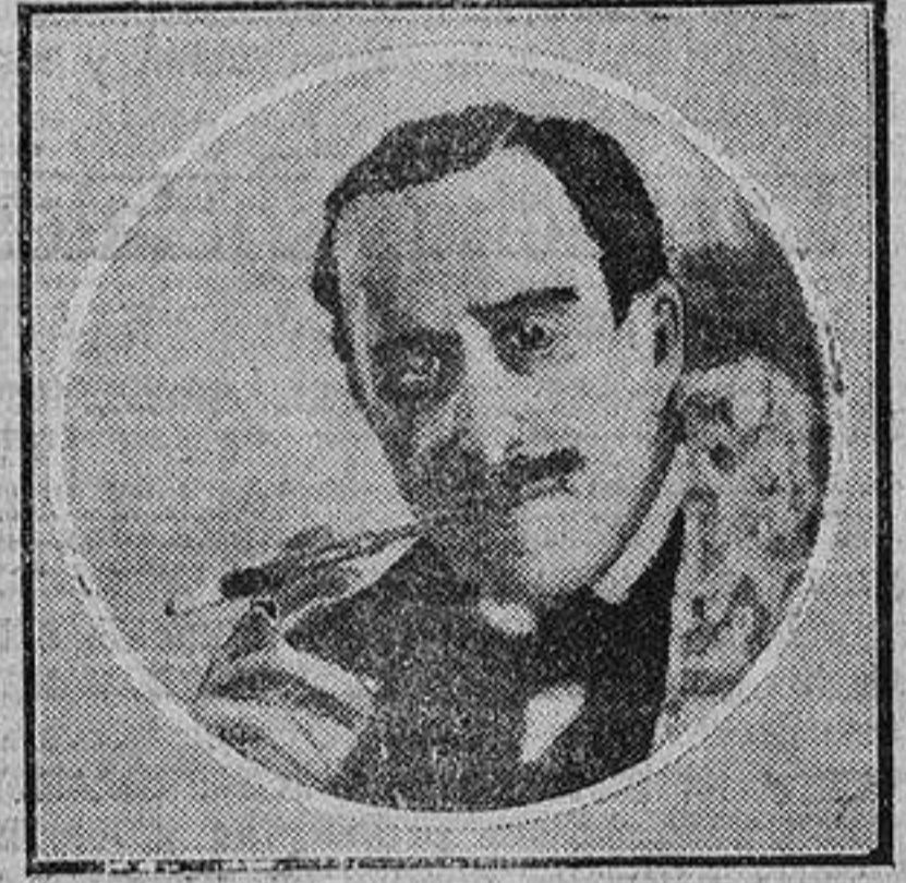
Lord Carnarvon, que tras diez y seis años de incansables trabajos, ha descubierto la prodigiosa necrópolis.

Lord Carnarvon y Mr. Howard Carter han revelado a un numeroso grupo de amigos lo que promete ser el más sensacional descubrimiento de arqueología egipcia del siglo. El hallazgo consiste, entre otros objetos, en la tumba del rey egipcio Tutankhamen, uno de los famosos reyes hereditarios de la XVIII.ª dinastía, quien llegó a ser adorado con el nombre de Amen. Poco se conoce de los últimos reyes, incluso de Tutankhamen, y el descubrimiento añadirá, seguramente, inapreciables datos a los conocimientos que poseemos de este período, y de la gran ciudad de Lel-el-Amarna, que fué fundada en el siglo XV, antes de Jesucristo, por Amenhotep IV, el primero de los reyes hereditarios. El notable descubrimiento es el premio de pacientes y perspicaces trabajos. Durante diez y seis años lord Carnarvon, auxiliado de Mr. Howard Carter, han ido excavando en el recinto de la antigua Tebas, situada en